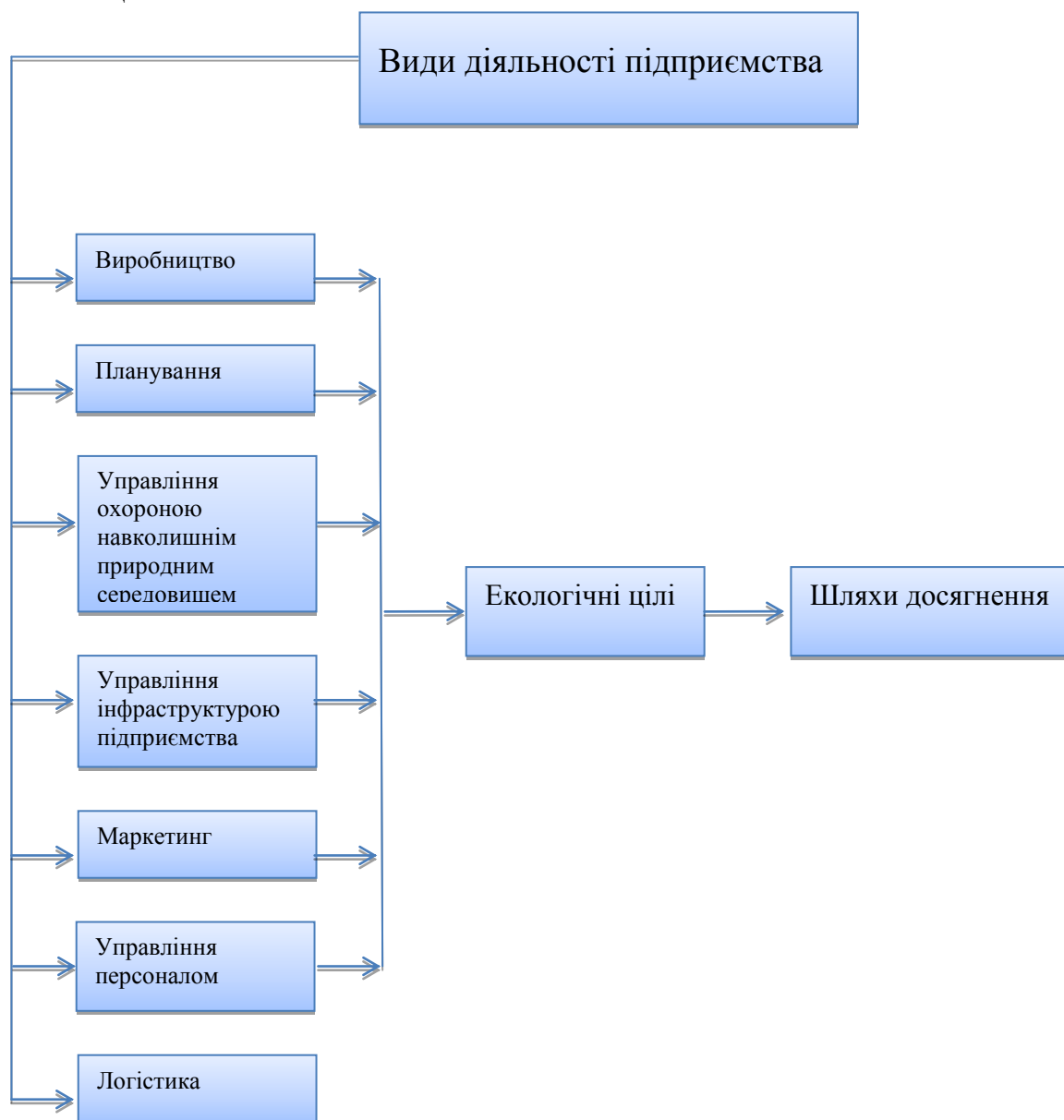
Рисунок 2. Види діяльності еколого-орієнтованих підприємств

діяльності підприємства. Аналізування видів діяльності підприємства з урахуванням функцій, які виконують за кожного виду діяльності, дасть можливість сформулювати конкретні екологічні цілі, яких потрібно досягати під час здійснення кожного виду діяльності підприємства, щоб підвищити рівень його еколого-орієнтованості. Стосовно кожної цілі запропоновано можливі способи їх досягнення. На рисунку 2 подано види діяльності еколого-орієнтованих підприємств, у процесі виконання яких встановлюються певні екологічні цілі.