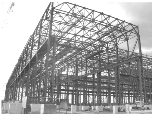
Рис. 1. Стальной каркас промышленного здания

При расчете стальных каркасов промышленных зданий (рис. 1) крановые мосты рассматриваются только как нагрузка и их совместная работа с каркасом здания не принимается во внимание. В действительности же мост крана участвует в работе каркаса, перераспределяя усилия между непосредственно нагруженными и ненагруженными элементами.