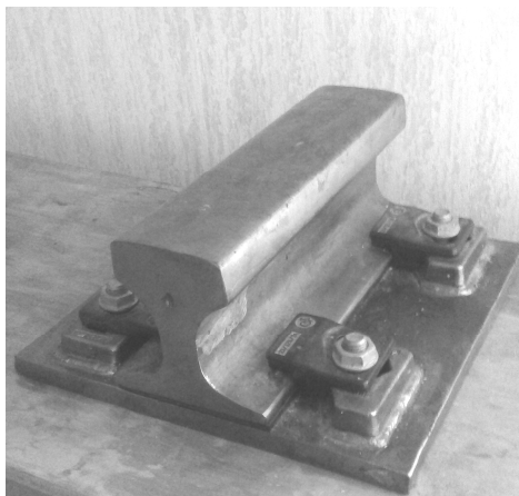
Рис. 2. Крепление рельса к верхнему поясу подкрановой балки

один из которых подробно исследовался кафедрой «Металлических, деревянных и пластмассовых конструкций» ОГАСА (рис. 2) возможен учет моста крана как жесткой связи.