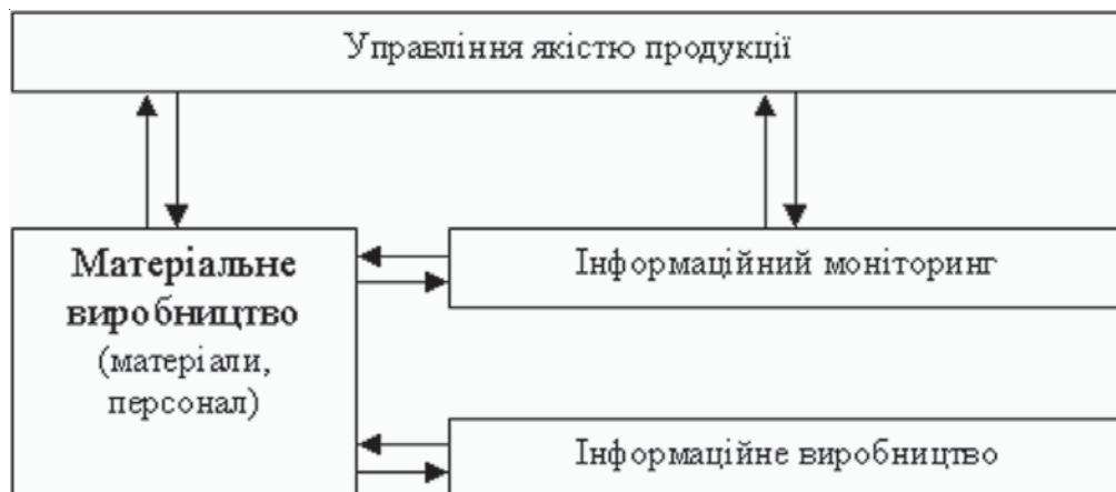
Рис. 1. Інформаційно-інтегрована система якості

Тому систему якості можна представити як єдність матеріального й інформаційного виробництв (рис. 1).