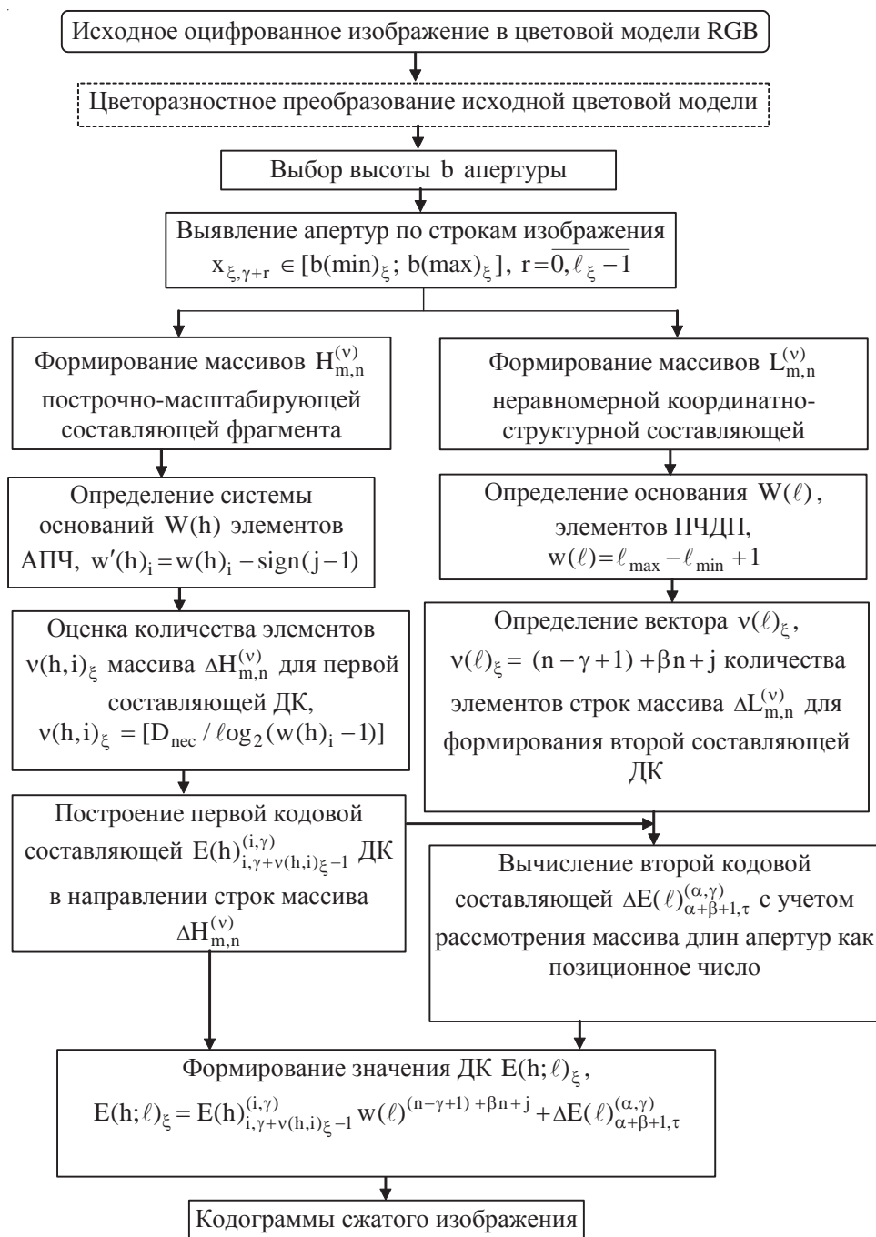
Рис. 2. Граф-схема технологии компрессии изображений

Таким образом, разработана организация выполнения кодирующих действий, позволяющая дополнительно сократить время на сжатие изображения за счет: