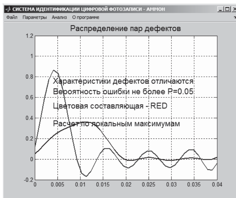
Рис. 1. Результаты дослідження двох зображень з різних цифрових фотоапаратів

На рис. 1 і 2 показані результати проведення ідентифікаційних досліджень цифрових фотоапаратів.