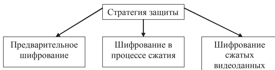
Рисунок 1. Стратегии защиты видеоинформации

В зависимости от вариантов позиционирования процессов сжатия и шифрования, возможны следующие стратегии, представленные на рисунке 1.