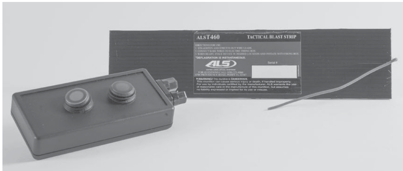
Рис. 14 Пристрій T-460 Tactical Blast Strip з пультом дистанційного керування

Пристрій виготовлено у вигляді прямокутника незначної товщини для забезпечення можливості його розміщення або просування в щілини між предметами (дверима і одвірком тощо) та оснащено пультом для дистанційного