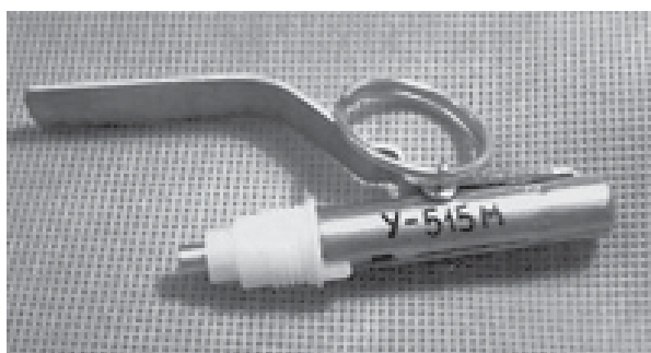
Рис. 12 Запобіжно-пусковий механізми типу ЗПМ

ЗПМ (рис. 12) призначений для оснащення ручних гранат нелетальної дії. Встановлюються на гранаті безпосередньо перед застосуванням шляхом закручування в перехідну втулку з різьбою М14Ч1,5.