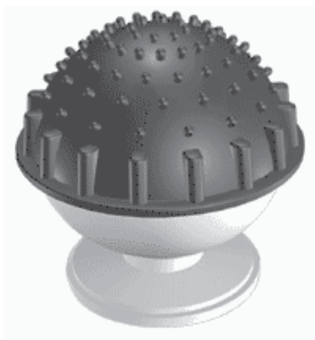
Рис. 9 Стационарний світлозвуковий пристрій "Пламя"

Пристрій (рис. 9) призначений для раптового впливу на озброєного злочинця і тимчасового придушення його психовольової стійкості.