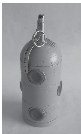
Рис. 7 Багатоелементна ручна світлозвукова граната "Факел"

Призначена для психофізіологічного впливу на правопорушників у ході операцій зі звільнення заручників і припинення масових заворушень.