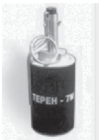
Рис. 3 Світлозвуковий пристрій "ТЕРЕН-7М"

Виріб "Терен-7М" (рис. 3) складається з перфорованого сталевого корпусу багаторазового використання, всередині якого розміщено світлозвуковий елемент.