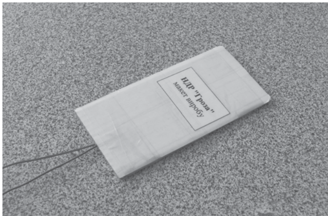
Рис. 17 Макетний зразок плоского світлозвукового пристрою

такого виробу можуть бути вирішені виробниками України, а тому в разі потреби спеціальних підрозділів ОВС у наявності плоских світлозвукових виробів з дистанційним керуванням їх виробництво може бути налагодженим за короткий термін.