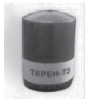
Рис. 2 Світлозвуковий пристрій “ТЕРЕН-7Е”

Виріб “Терен-7Е” (рис. 2) складається з герметичного полімерного корпусу, всередині якого розміщено світлозвуковий елемент, що приводиться в дію електрозапалювачем.