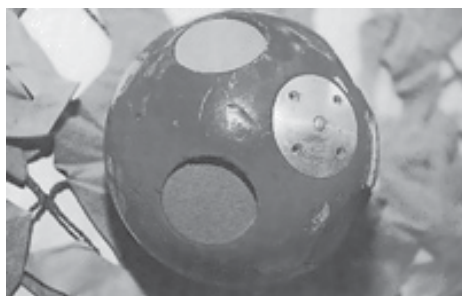
Рис. 6 Багатоосередкова світлозвукова граната “Взлет-М”

Граната (рис. 6) призначена для світлозвукового впливу на правопорушників. Має оригінальну конструкцію. Корпус виготовлено у формі кулі, у якому розміщені елементи, заповнені піротехнічним складом. Вони викидаються з корпусу гранати через 3 с після спрацювання капсуля-запалювача теркового типу.