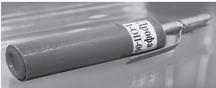
Рис. 11 Ручна граната подразнювальної та світлозвукової дії “Дрофа”

Граната (рис. 11) призначена для комбінованого нелетального впливу на правопорушників. Застосовується в приміщеннях обмеженого об’єму, салонах літаків, потягів, автомобілів.