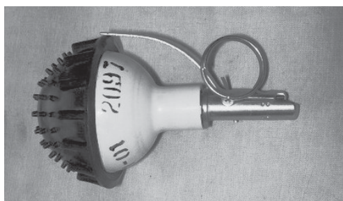
Рис. 4 Безосколкова світлозвукова граната "Заря-2"

Для забезпечення можливості виконання працівниками правоохоронних органів Російської Федерації різних практичних завдань підприємствами країни виробляється досить широкий спектр різноманітних світлозвукових пристроїв та гранат, у тому числі комбінованої дії: світлозвукової та подразнювальної, світлозвукової та травматичної тощо. Нижче наведено характеристики деяких з них.