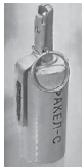
Рис. 8 Одноелементна ручна світлозвукова граната "Факел-С"