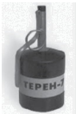
Рис. 1 Світлозвукова граната “ТЕРЕН-7”

Перш за все, зазначимо, що світлозвукові гранати та пристрої призначені як для припинення протиправних дій окремих осіб, так і для ліквідації масових заворушень шляхом тимчасового придушення психовольової стійкості правопорушників за допомогою світлових і звукових імпульсів високої інтенсивності. На сьогодні на оснащенні підрозділів МВС України перебувають світлозвукові гранати та пристрої “ТЕРЕН-7”, “ТЕРЕН-7Е”, “ТЕРЕН-7М”. Основні характеристики виробів наведені нижче.