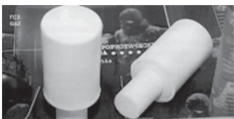
Рис. 5 Ручні світлозвукові безосколкові гранати ГСЗ-Т, ГСЗ-Ш

Гранати (рис. 5) психофізіологічного (відволікаючого і приголомшуючого) ефекту та механічної іммобілізуючої дії з метою тимчасового виведення правопорушників з ладу. Необхідний ефект досягається сильним світловим спалахом та звуковим імпульсом у ГСЗ-Т, а також дією уражаючих елементів у виробі ГСЗ-Ш.