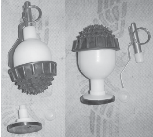
Рис. 10 Стационарний світлозвуковий пристрій (граната) “Пламя-М” (“Пламя-М2”)

Пристрій (граната) (рис. 10) служить для впливу на озброєних правопорушників і тимчасового придушення їх психофізіологічної стійкості при звільненні заручників і припиненні масових заворушень.