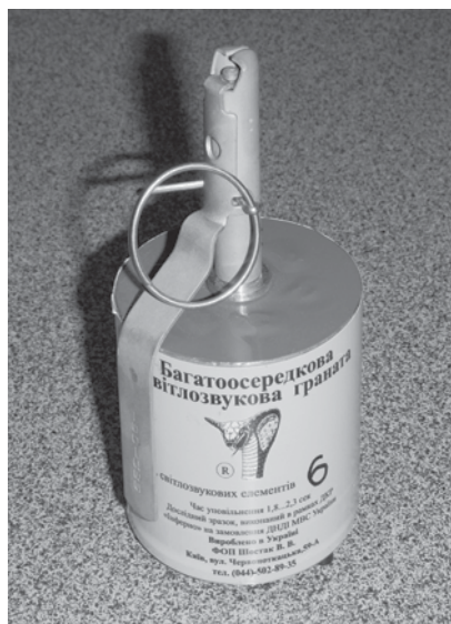
Рис. 15 Багатоосередкова світлозвукова граната

Однією з таких розробок, проведеною на замовлення УШР “Сокіл” ГУБОЗ, було створення багатоосередкової світлозвукової гранати з серією вибухів (шифр “Інферно”). Метою створення цієї світлозвукової гранати з серією вибухів є підвищення ефективності дій особового складу спецпідрозділів, що залучається до проведення спеціальних операцій. У результаті проведення робіт створено партію дослідних зразків світлозвукових гранат “Інферно” (рис. 15) з кількістю світлозвукових елементів від 3 до 6.