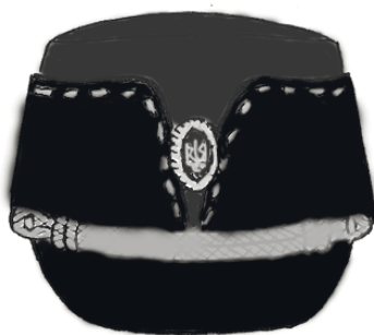
Рис. 4. Кашкет літній для військовослужбовців бригади охорони дипломатичних представництв

Кашкет літній для підрозділів охорони закордонних представництв також мав основні характерні риси мазепінки – козирок та відвороти з V-подібним вирізом спереду. Кольорова гама сучасної мазепінки співпадає з гамою на мазепінках української поліції: темно-синя та малинова. Декоративні елементи (філігранний ремінець та золотисте шиття по краю одворота) обумовлені парадним призначенням кашкету літнього (рис. 4). Тож незважаючи на видозміну конструктивних ліній, областей пофарбування та наявність декоративних елементів, кашкет літній окремої бригади охорони дипломатичних представництв є прямим “нащадком” кашкета-мазепінки.