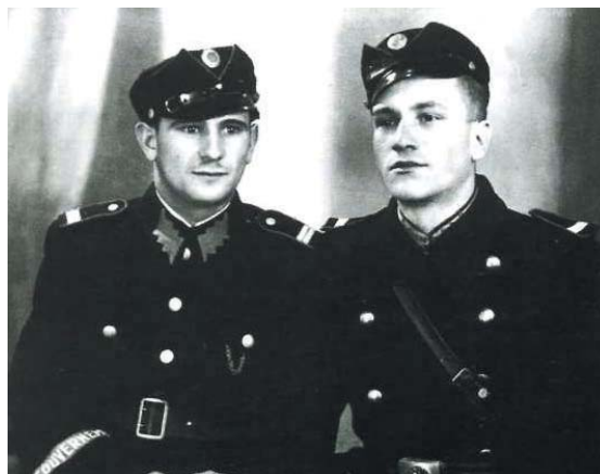
Рис. 3. Молодші командири “української поліції” Генерал-Губернаторства в мазепінках темно-синього кольору, 1941 рік

одностроях (темно-синій кітель та галіфе синього кольору були вилучені з трофейних складів польської поліції) для української поліції було встановлено носіння головного убору – кашкета-мазепінки темно-синього кольору (рис 3).