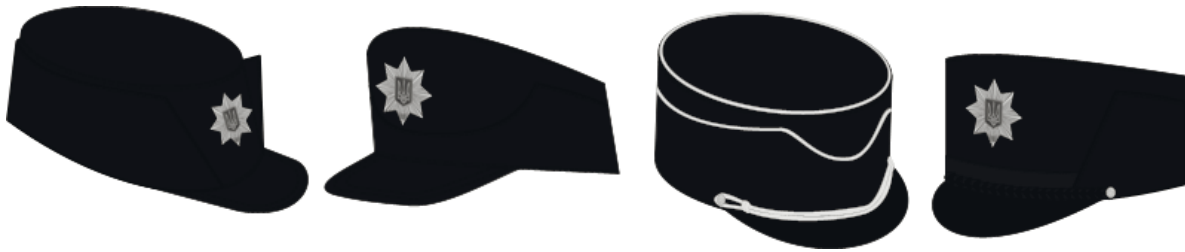
Рис. 5. Рисунки кашкетів-мазепінок, які розробляються на цей час

Серед проектів головних уборів, які розробляються на цей час, та виготовлених зразків деякі кашкети також мають характерні для мазепінок елементи, а саме відвороти з V-подібним вирізом спереду. Ці зразки можуть бути згодом впроваджені для носіння співробітниками Національної поліції України (рис. 5).