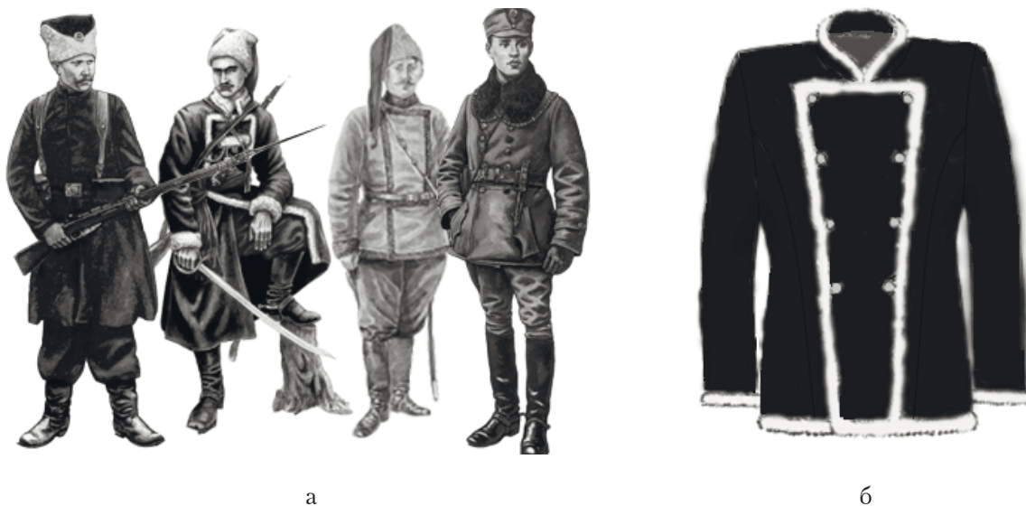
Рис. 6. Традиції використання жупана: а) у збройних формуваннях періоду 1917–1921 рр; б) в одностроях бригади охорони дипломатичних представництв МВС України

держав можна побачити, що основні конструктивно-декоративні елементи бекеші (стоячий комір, трапецієподібна центральна застібка, опорочування хутром борта, рукавів та коміра) були виконані в кольоровій гамі одностроїв “Синьої дивізії” (рис. 6).