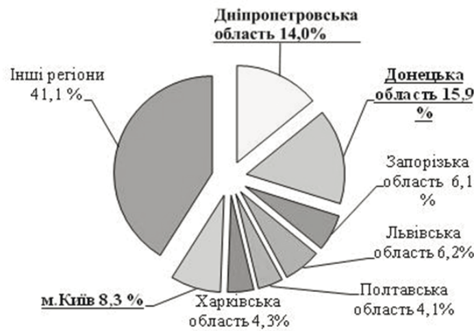
Рис. 1. Діаграма кількості нещасних випадків по регіонах України за 2015 рік

Результати досліджень. Одним з головних напрямів роботи служб з охорони праці є профілактична робота із запобігання нещасним випадкам на виробництві, професійним захворюванням та іншим випадкам загрози здоров'ю осіб, викликаним умовами праці. За статистичними даними, впродовж останніх років існує тенденція збільшення виробничого травматизму [2]. Водночас статистичні дані не відображають реального стану промислової безпеки та охорони праці, оскільки не враховують економічну динаміку, рівень життя населення та інші чинники. Як наслідок, ризик зазнати травму на виробництві продовжує залишатися високим. Збільшується також відсоток кількості випадків травмування з важкими наслідками до загальної кількості травмованих. На рис. 1 наведено відсоткове співвідношення кількості нещасних випадків по регіонах України за 2015 рік.