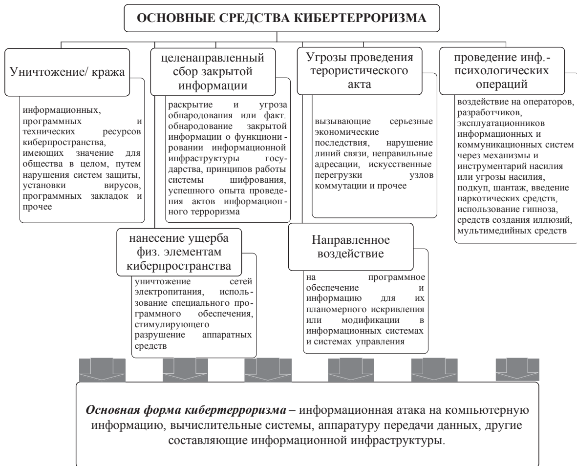
Рис. 1. Основные средства кибертерроризма

Анализ рис. 1 показывает что, терроризм все более становится информационной технологией особого типа, поскольку террористы все шире используют возможности современных информационно-телекоммуникационных систем для связи и сбора информации, большинство террористических актов рассчитаны не только на нанесение материального ущерба и угрозу жизни и здоровью людей, но и на информационно-психологический шок, воздействие которого на большие массы людей создает благоприятную обстановку для достижения террористами своих целей.