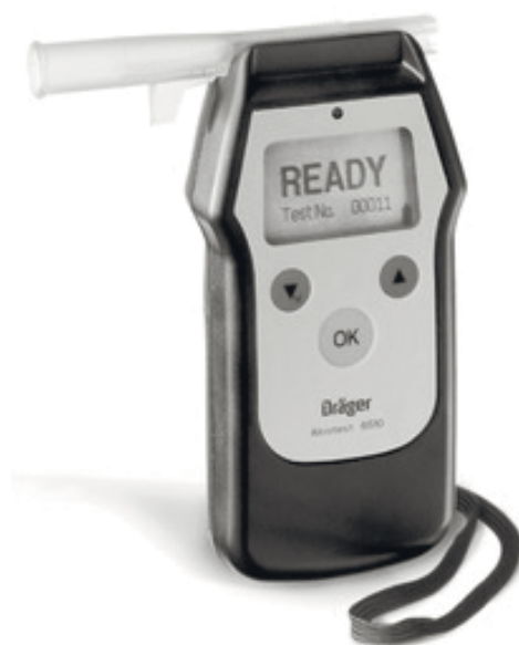
Рис. 4. Загальний вид електродіагностичного приладу “Dräger Alcotest 6510”

Серед найпопулярніших моделей алкотестерів марки Dräger можна назвати компактний і зручний в експлуатації електродіагностичний прилад “Dräger Alcotest 6510” (див. рис. 4), який дає змогу отримувати точний і швидкий аналіз умісту алкоголю в повітрі, що видихається. Завдяки широкому діапазону можливих конфігурацій, портативний прилад можна легко адаптувати до різних міжнародних норм і рекомендацій. “Dräger Alcotest 6510” має інтуїтивно зрозумілий для користувача інтерфейс, що спрощує роботу з ним. Автоматичні процедури відбору проб і калібрування роблять пристрій простим у використанні. Останні розробки в електронних технологіях дали змогу радикально скоротити час готовності приладу до вимірювання. Технічні характеристики наведені в табл. 7 [5].