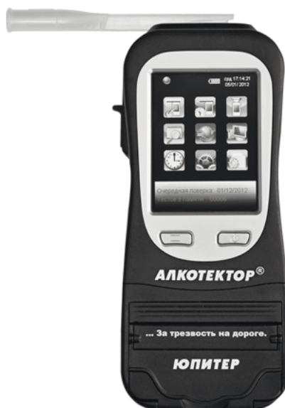
Рис. 3. Загальний вигляд алкотестера “Алкотектор Юпитер”

Технічні характеристики приладу “Алкотектор Юпитер” наведені в табл. 3 [5, 6].