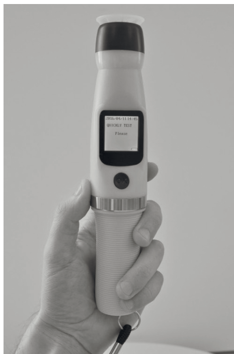
Рис. 6. Загальний вид електродіагностичного приладу “АлкоФор S50”

Розглянемо професійний алкотестер “АлкоФор S50” (див. рис. 6 та табл. 9) [8].