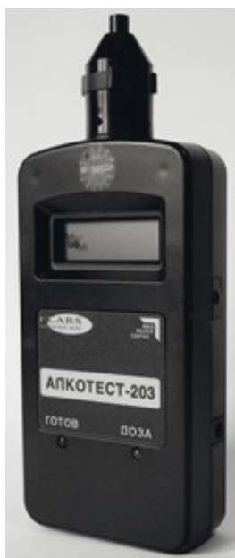
Рис. 2. Загальний вигляд алкотестера “Алкотест 230”