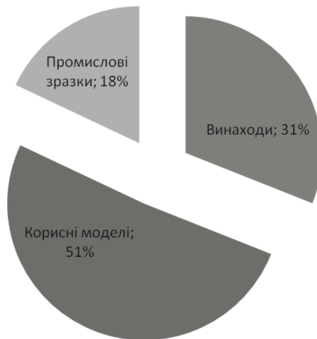
Рис. 2 Співвідношення кількості отриманих охоронних документів на об'єкти промислової власності, створених у МВС України та ЦОВВ, діяльність яких спрямовується і координується через МВС України станом на I квартал 2017 р.

З огляду на відображені дані на рис. 1–2 можемо констатувати, що загалом отримано 505 патентів на об'єкти промислової власності, створених у МВС України та ЦОВВ, діяльність яких спрямовується і координується через МВС України, з них 153 патентів України на винаходи, 262 патентів України на корисні моделі та 90 патентів України на промислові зразки. Найбільші показники винахідницького рівня та інноваційної діяльності показали навчальні та наукові заклади МВС України та ДСНС України. За ними йдуть структурні підрозділи МВС України та КП НВО “ФОРТ” МВС України. Позитивна тенденція реєстрації власних результатів науково-технічної діяльності свідчить про їх прагнення не тільки закріпити за ними авторство, але й отримати виключне право на використання та розпорядження власними розробками.