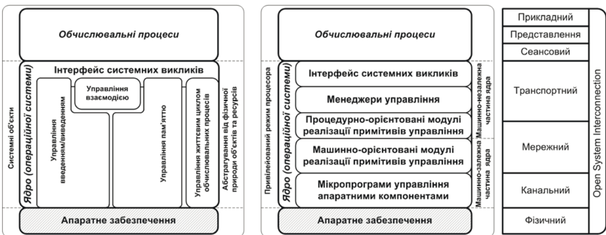
Рис. 1. Обчислювальна складова типового програмно-апаратного засобу