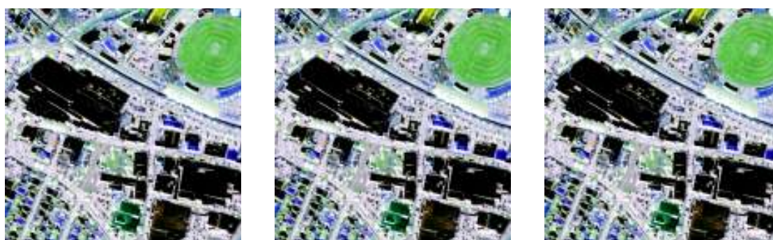
Рисунок 4 – Изображение, полученное после преобразования Gram – Schmidt: а) - метод ближайшего соседа; б), в) – кубическая конволюция