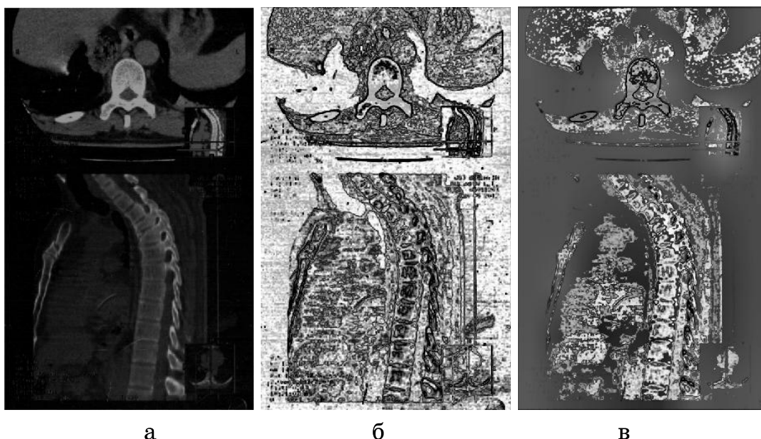
Рисунок 2 - Сегментация томограммы: а – исходное изображение; б – сегментация на основе максимума функций принадлежности, полученных методом FCM ( N_{cl}=6 ); в – максимум независимых компонент (5 составляющих)

Применение FCM позволило детализировать изображение, выделить дефекты пленки, однако, сформированные классы оказались слишком мелкими, соизмеримыми со структурным шумом. ICA обеспечивает новое представление матрицы нечетких функций принадлежности U , которое позволяет повысить помехоустойчивость и достоверность сегментации изображений.