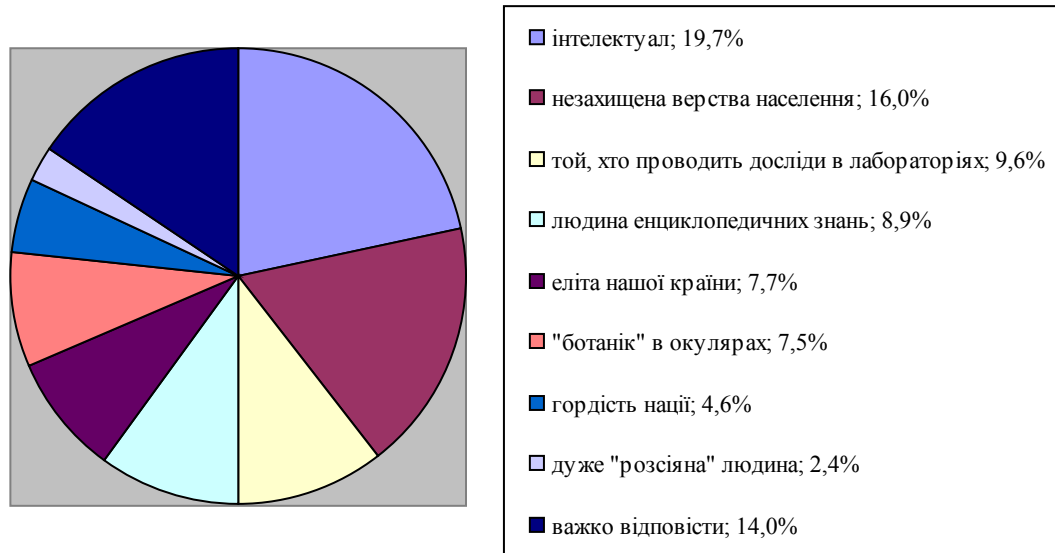
Рис. 1. Соціальні стереотипи стосовно образу вченого в сучасному українському суспільстві (у % до кількості опитаних)

Суспільство також стигматизує, формує певний набір стереотипів щодо уявлень про те, яким має бути вчений, науковець. Для прикладу, розглянемо дослідження, проведене у ВНЗ та НДІ Дніпропетровської області, метою якого було виокремити чинники, що впливають на мотивацію наукової діяльності вчених, створити соціальний портрет вченого. Загальна кількість респондентів становила 1118 осіб, з яких молоді вчені – 556 [10] (рис. 1).