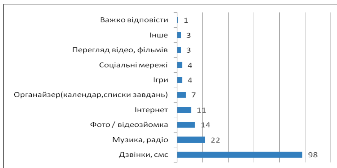
Рис. 1. Розподіл відповідей на запитання: “Яким чином Ви використовуєте мобільний телефон?”, %

Що стосується платформ, то найпоширенішою залишається Android (27%), на другому місці – IOS (13%), на третьому – Symbian (12%), що дивно, з огляду на те, настільки значний розрив за кількістю апаратів iPhone і Nokia; 7% припадає на частку Windows Phone, а 29% важко відповісти, на якій операційній системі працюють їх мобільні телефони.