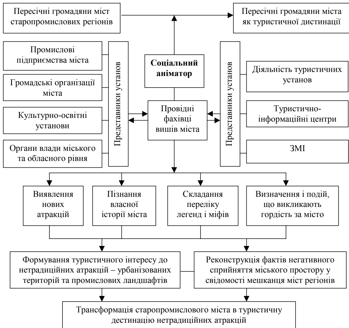
Рис. 3. Дія соціальної анімації на шляху розвитку туризму у старопромисловому місті

Висновки. Міста старопромислових регіонів України, як правило, мають достатню кількість вишів, які можуть бути провідними лідерами у застосуванні соціальної технології соціальної анімації для зміни ставлення промисловців, можновладців та мешканців міста від суто промислового до туристичного з нетрадиційними атракціями на базі урбанізованих територій та промислових ландшафтів через широке залучення пересічних громадян. Це потребуватиме значних зусиль фахівців як з соціології та туризмології, так і економістів, правознавців у розробці інноваційних концепцій та стратегій розвитку економіки промислових міст старопромислових регіонів Сходу України як туристичних. Проблемою є відсутність у більшості міських програм розвитку туризму такого виду, як урбанізовано-промисловий туризм. Вирішення цього питання потребує розгляду соціальної анімації у побудові діалогу між населенням і органами місцевого самоврядування, що буде розглянуто у наступних дослідженнях.