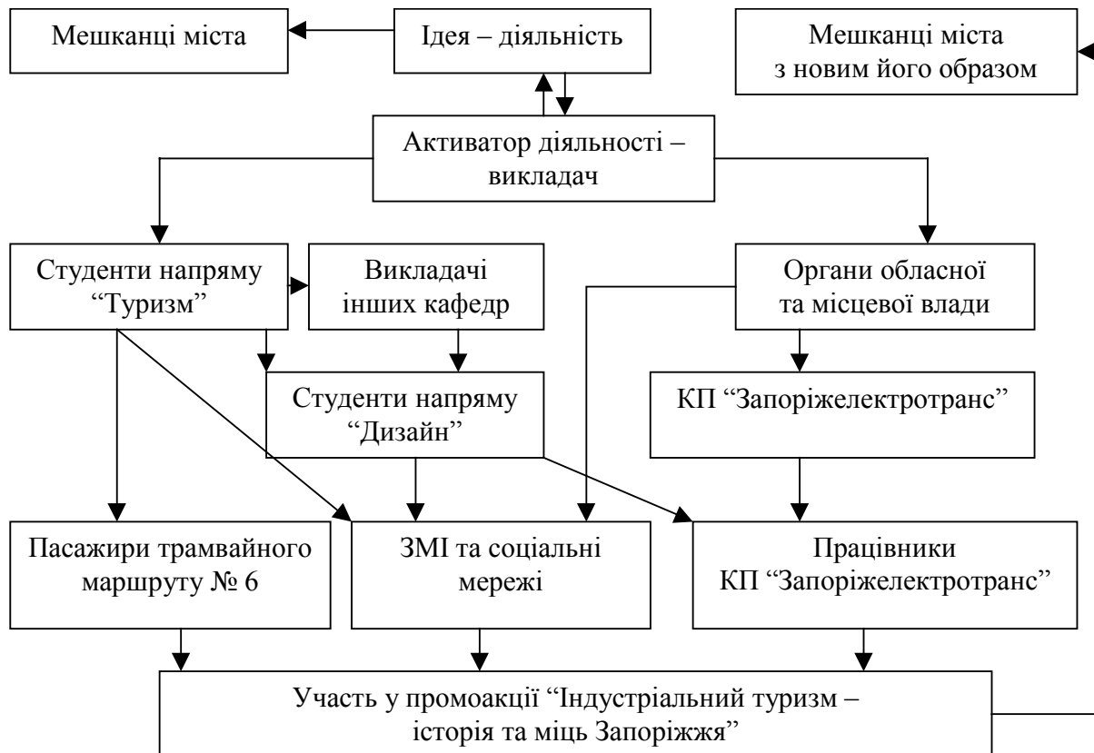
Рис. 2. Процес залучення мешканців міста до участі туристичної розбудови міста

широку підтримку й бажання допомогти [5]. Мінімальний результат – набуття практичного досвіду студентами у створенні туристичного продукту на нетрадиційних територіях міста, розширення інформації про промисловий туризм серед населення, залучення населення до пізнання історії місця проживання. Процес активізації населення можна схематично відобразити у такий спосіб (рис. 2).