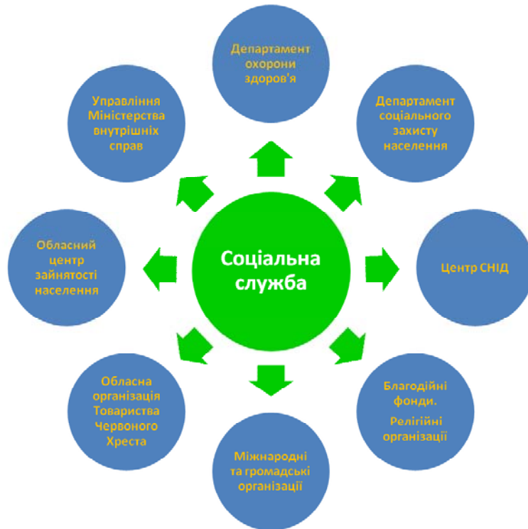
Рис. 2. Спільна робота соціальної служби КУ “Обласний тубдиспансер” ЗОР із зовнішніми службами та організаціями