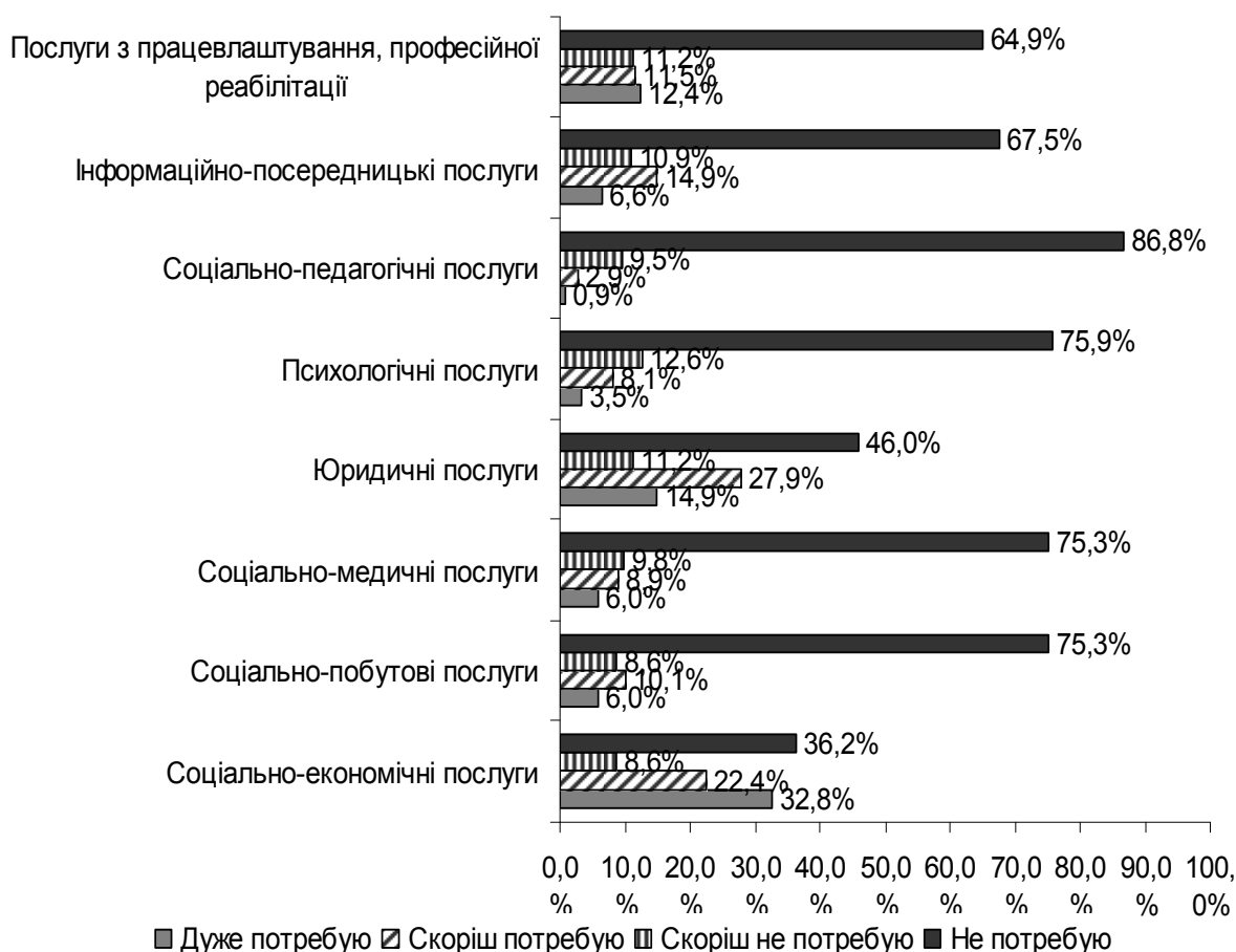
Рис. 2. Оцінка потреб у соціальних послугах

Висновки. Отже, ефективним механізмом надання соціальних послуг на рівні об'єднаної територіальної громади може виступити соціальне партнерство як взаємодія основних соціальних суб'єктів: державних і місцевих органів управління, бізнес-структур і недержавних некомерційних організацій у сфері надання соціальних послуг.