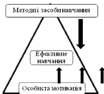
Рис. 1. Співвідношення базових факторів ефективного навчання

Коучингове консультування дає змогу побудувати схематичну модель для мотивації в освітній діяльності (рис. 1).