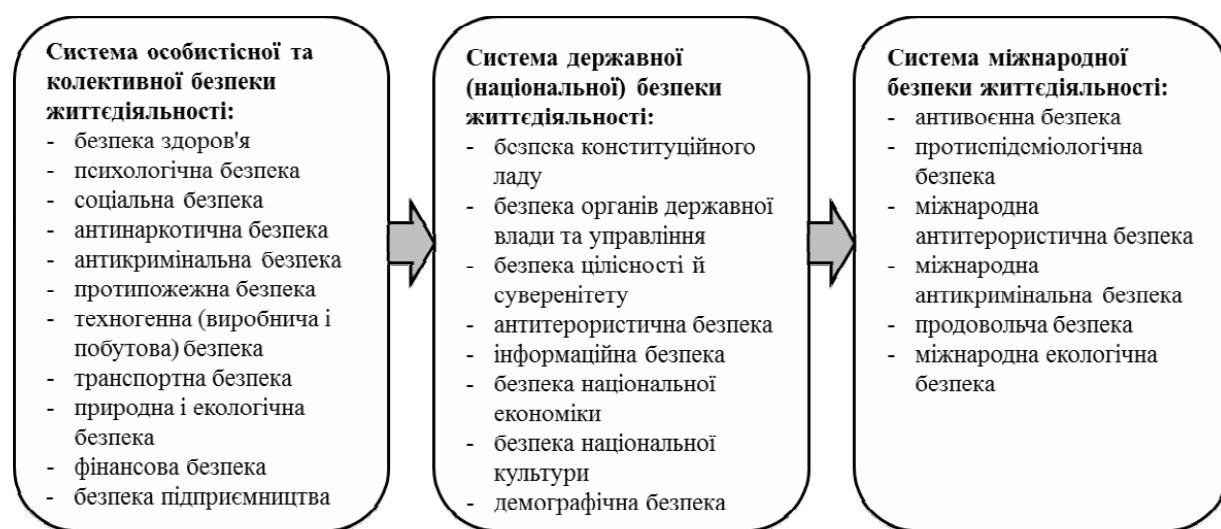
Рис. 3. Види загроз і різновиди безпеки відповідно до структурних рівнів їх прояву [8, с. 19]

А. Лобачов, здійснюючи аналіз явища безпеки життєдіяльності в межах структурного підходу, дійшов висновку, що основою будь-яких систем безпеки є її особистісна й колективна (суспільна) складові. Іншими словами, первинним об'єктом дослідження у сфері безпеки повинна виступати все ж таки конкретна особистість. Виходячи з наявних структурних рівнів, він виділив відповідні їм види загроз і різновиди безпеки життєдіяльності (рис. 3) [8, с. 19].