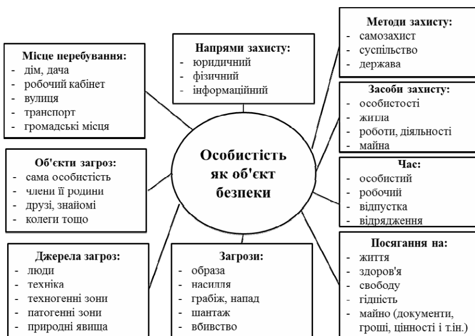
Рис. 4. Концепція безпеки особистості [11, с. 77]

купність загроз у системі «людина – соціальне середовище». Зазначені чинники мають, передусім, соціально-психологічний характер і виявляються в поведінці людини в різних варіаціях. Вони можуть бути, з одного боку, стійкими й тривалими за часом дії, детерміновані незадоволеністю соціальним становищем, результатами трудової діяльності, байдужістю оточення. З іншого – ситуативними, що виникають під впливом різних непорозумінь у відносинах. Негативний вплив зазначених чинників може виявлятися через поведінкові відхилення, натомість найпоширенішими наслідками є конфлікти, тривожність, страх, паніка тощо. Соціальна практика показує, що людина порушує правила безпечної життєдіяльності через незнання, невміння або небажання дотримуватися вимог безпеки [12, с. 78].