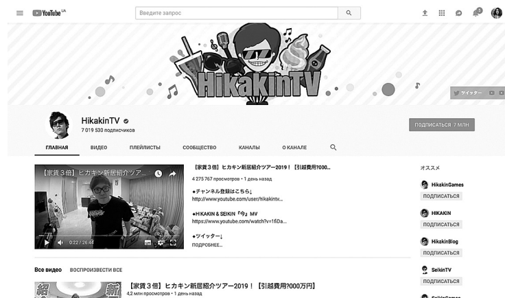
Рис 1. Скріншот сторінки сайту влогера Хікакін, який виробляє відео для чотирьох каналів на відеохостингу YouTube та має сумарно близько 14 мільйонів дописувачів (URL: https://www.youtube.com/user/HikakinTV )

У результаті, сьогодні ми навряд чи можемо розглядати без урахування тієї його частини, що відбувається онлайн. Майже всі великі японські видання та телеканали мають свої сторінки, портали та сайти в мережі інтернет: NHK ( www.nhk.or.jp ), 毎日新聞 ( @mainitisinbun — сторінка у соціальній мережі Twitter), 朝日新聞 ( www.asahi.com ) та ін. Там відбуваються прямі трансляції, дублюються матеріали з друкованих газет, публікуються подкасти, ведеться радіомовлення. Пересічні японці зараз не тільки споживають медіаконтент, але і створюють його. Блоги, записи в соціальних мережах, подкасти та власні відеоканали — весь цей контент, який створюють не офіційні медіа, а звичайні люди, теж є частиною сучасного медіадискурсу в Японії.