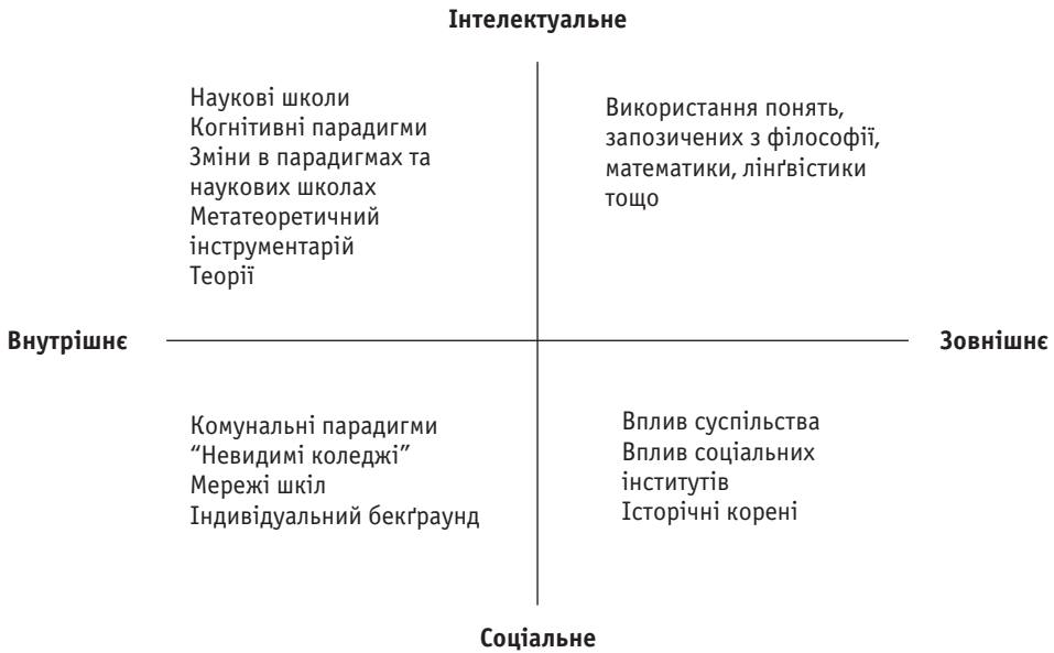
Рис. 3. Головні підтипи метатеорії як засобу досягнення глибшого розуміння теорії [Ritzer, 1988: p. 190]

Полюс “внутрішнього” умовно позначає все у межах соціології, а полюс “зовнішнього” — все поза межами соціології, що може впливати на неї. Полюс “інтелектуального” позначає все, що стосується когнітивної структури (поняття, ідеї, теорії, метатеорії тощо), а полюс “соціального” — соціальної структури (індивіди, спільноти, інституції, суспільство тощо). Умовний перетин ліній зазначених концептуальних вимірів розмежовує квадранти, що позначають 4 підтипи метатеоретизування для глибшого розуміння вже наявних соціологічних теорій 1 . Внутрішньо-інтелектуальний підтип метатеоретизування охоплює спроби аналізу когнітивних структур наявних соціологічних теорій із використанням різних концептуальних знарядь (наприклад: [Тернер, 1985]). Внутрішньо-соціальний підтип об’єднує спроби вивчення впливу особистого бекґраунду теоретиків, наукових шкіл, “невидимих коледжів” (Т.Кун), інституцій та соціальних мереж фахової спільноти соціологів на соціологічне теоретизування (наприклад: [Рыбщун, 2010]). Зовнішньо-інтелектуальний підтип групує спроби вивчення впливу інших наук на розвиток соціологічної теорії (наприклад, відповідний вплив мовознавства проаналізовано в: [Ліутар, 1995]). Зовнішньо-соціальний підтип утворюють спроби вивчення впливів національних або соціально-історичних обставин на розбудову соціологічної теорії (наприклад: [Гоулднер, 2003; Козер, 2006]). У підсумку досягнуте глибше розуміння наявних со-