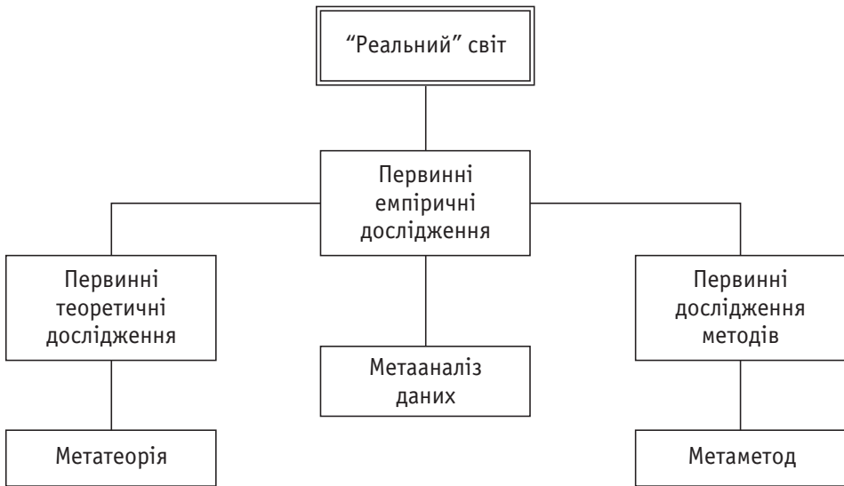
Рис. 1. Взаємозв'язок між первинними дослідженнями і метадослідженнями [Zhao, 1991: p. 380]

методичних підходів для вивчення одного й того самого соціального феномену.