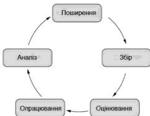
Рис. 1. Цикл процесу аналізу злочинності (за Ratcliffe, J. (2002р.))

електронних баз щодо скоєння окремих злочинів у міському просторі. Використання вторинних даних є типовим для процесу аналізу злочинності, оскільки вони постійно збираються і зберігаються департаментом поліції. Проте вони не завжди є достатніми. Для вичерпного аналізу злочинності дослідники використовують первинні емпіричні дані, зокрема: соціологічні опитування (інтерв'ювання, анкетування), натурні обстеження тощо. Інформація може бути систематизована в таблиці чи у формі звіту. Закордонні науковці наголошують на тому, що точність і відповідність даних залежить від уважного і комплексного підходу до їх збору [4].