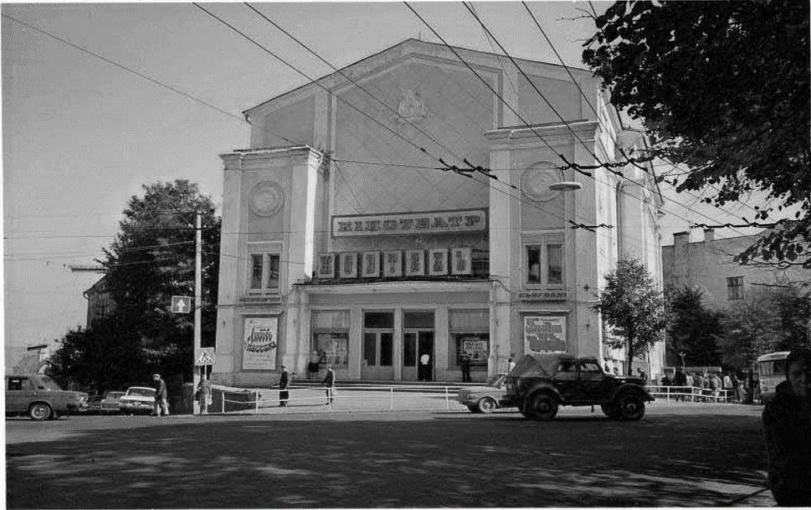
Рис. 3. Реконструйований кінотеатр у 1959 році.

Головною ідеєю та задачею в 1952 році було рухатися в ногу з часом та надати чернівчанам можливість перегляду фільмів.. (рис№3) [2.3]