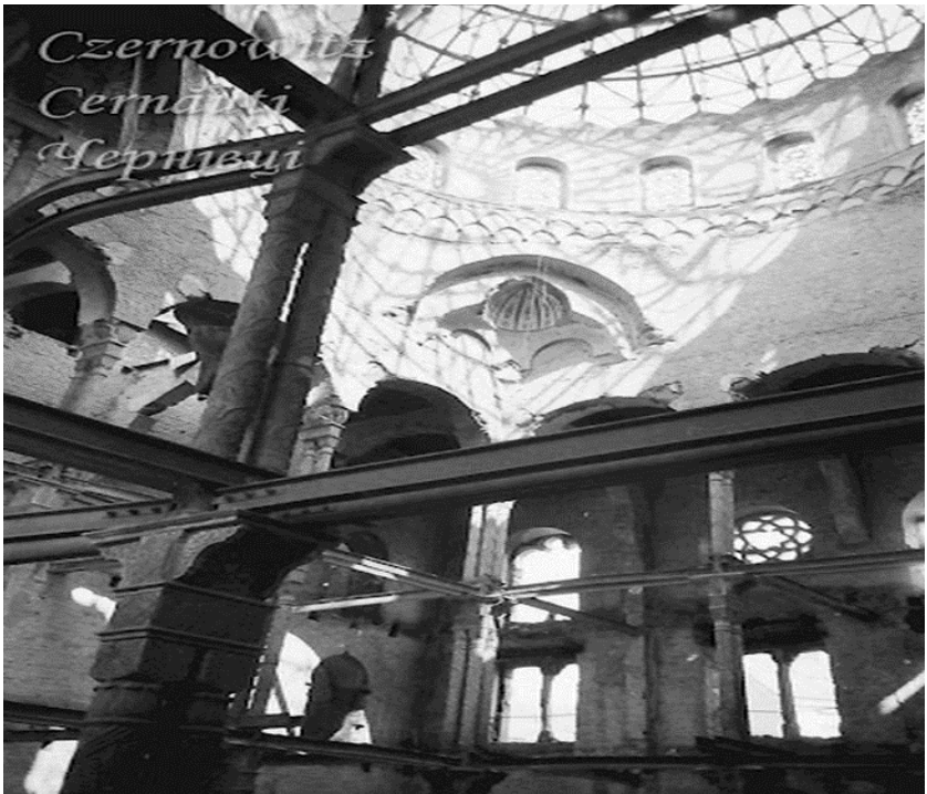
Рис. 2. Руїнація після Великої вітчизняної війни.

Історія синагоги не має щасливого кінця, адже на початку Другої світової війни у липні 1941 року німецько-румунські війська спалили її (рис.№2). Будівлі надали друге дихання у 1952 році запроєктувавши на цьому місці кінотеатр, зробивши реконструкцію, добудувавши четвертий поверх та двосхилий дах з фронтоном, і в 1959 році в ньому був відкритий кінотеатр «Жовтень», перейменованій в 1992 році в «Чернівці». Сучасна будівля мало схожа на синагогу, хоч і зберегла деякі зовнішні обриси.