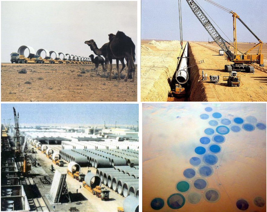
Рис. 2. Загальний вигляд будівництва та орошені в результаті реалізації проекту поля (темні круги) в пустині Сахара

Саме будівництво природним чином розділилося на п'ять основних фаз.