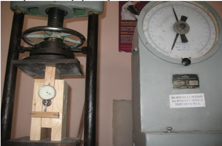
Рис.2. Випробовування зразка на саморізах (початкове положення)

Дослід проводиться в лабораторії за допомогою гідравлічного пресу. Для вимірювання деформації зсуву дошок одна відносно одної для зразків нагельного з'єднання встановлюють індикатор, головка якого впирається в дерев'яну полицку, яка закріплена до зовнішніх дошок. На шві для контролю наклеюють смужку паперу з міліметровою розміткою, яку після висихання розрізують лезом безпечної бритви по шву зразка (рис.2).