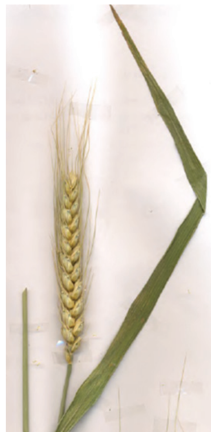
Рис. 1. Колос пшениці м'якої Ювівата 60

Новий сорт пшениці м'якої озимої Ювівата 60, виділений багаторазовим добором з F 3 гібридної комбінації (Поліська 90 х Мирлебен) х (Holger 0 х ППГ 296), належить до лісостепової та поліської екологічних груп різновидності еритроспермум. Сорт середньорослий, інтенсивного типу розвитку, добре реагує на рівень культури землеробства, середньостиглий; тривалість вегетаційного періоду – 281-289 діб, стійкий проти вилягання. Новий сорт пшениці має високу резистентність проти несприятливих умов зимовесняного та літнього періодів (морозо-, зимо- та посухостійкість 8–9 балів), ураження збудниками Sphaerotheca morsuae Berk et Curt. , Puccinia recondita f. sp. tritici Rob. ex Desm. , Fusarium graminearum Schwabe і Cochliobolus sativus становить 8 балів; стійкий також проти осипання і проростання його зерна на пні. Колос пшениці м'якої Ювівата 60 рихлий, білий, остистий, пірамідальний, пониклий, довжиною 10-14 см (рис. 1). Остюки рослин сорту білі, розгалужені, продовгуваті – 4,8-6,1 см, колоскова луска – овально-яйцеподібної форми, слабоопушена, довжиною – 1,4-1,5 мм, ширина – 0,6-0,8 мм; плече колоскової луски шириною 0,5-0,7 мм, злегка скошене (ширина квіткової луски збільшена, порівняно з батьківськими формами, що є передумовою формування крупного зерна). Зубець колоскової луски прямий, довжиною 0,7-0,6 мм. Кіль довжиною 0,4 мм. Зернівка червона, виповнена, гладенька, крупна, овальної форми, довжиною 7-8 мм, шириною – 3-3,2 мм, товщиною – 3,8-3,9 мм.