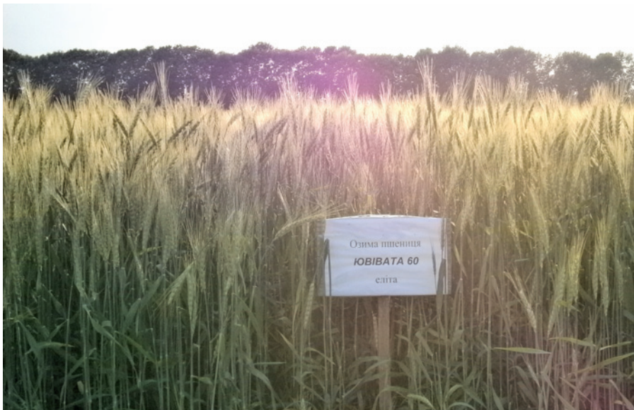
Рис. 3. Фітоценоз пшениці м'якої озимої сорту Ювівата 60, стаціонар Носівської селекційно-дослідної станції, 2013 р.

за рахунок міцного та потовщеного стебла;