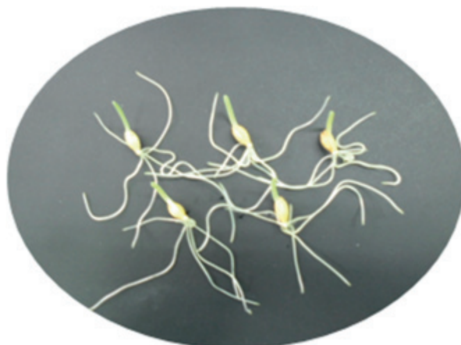
Сорт Галичанин – ярий