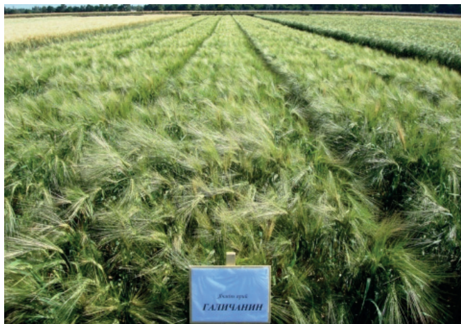
Рис. 5. Сорт Галичанин у посушливому році (СГП, 2010 р.)

рядного ячменю напівкарликового типу, створений для північних та північно-західних регіонів України під назвою Галичанин (02-131-5), був переданий на державне сортопробування і з 2014 року внесений до Реєстру. У Лісостепу та Поліссі в посушливих умовах, які склалися в 2011–2013 роках, за врожайністю значно перевершив інші сорти. Галичанин формує розвинену кореневу систему та розвинений колеоптиль