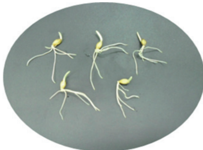
Сорт Луран – озимий