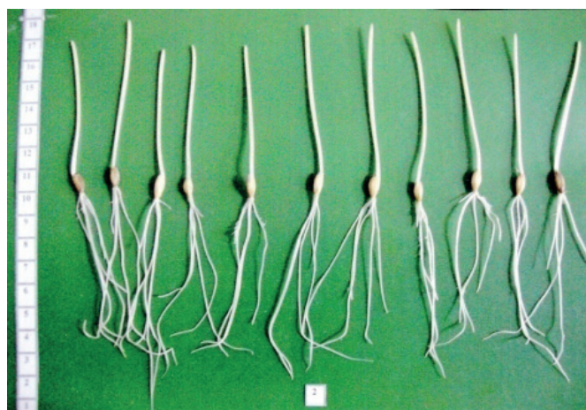
Рис. 2. Сорт Первенець (10 діб, 10°C у темряві)