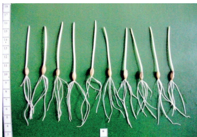
Рис. 3. Сорт Галичанин (10 діб, 10°C у темряві)

Поступово вдалося створити генотипи ярого шестирядного ячменю, врожайність якого вже не дуже істотно зменшувалася за несприятливих умов вирощування.