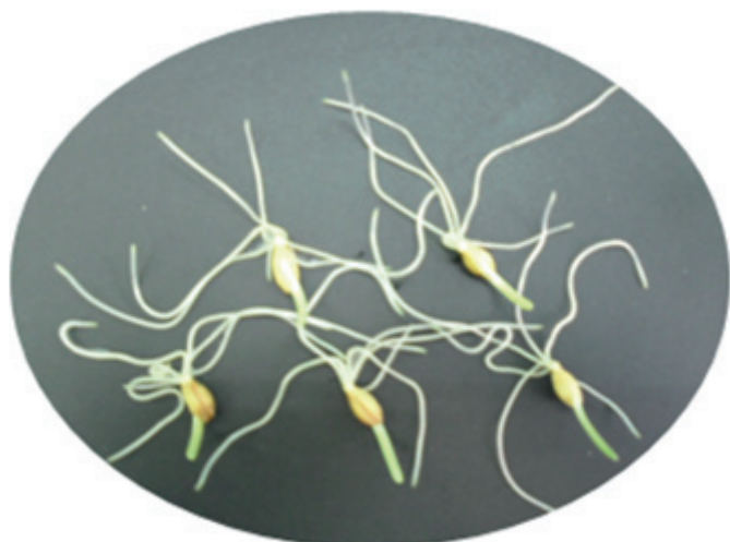
Сорт Гетьман – ярий