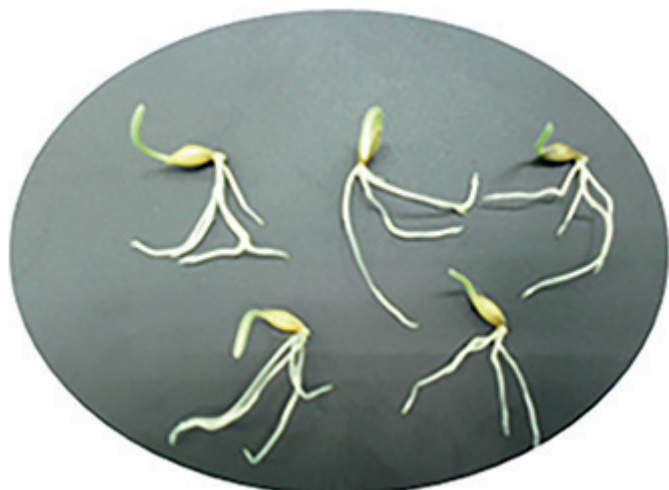
Сорт Достойний – озимий

Роль первинної кореневої системи, довжини колеоптиля та холодостійкості у формуванні врожаю напівкарликових сортів ячменю рога ( Hordeum vulgare L.)