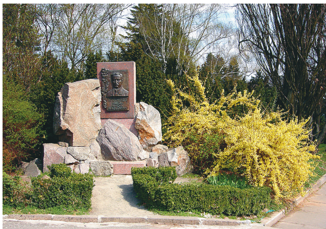
Рис. 6. Меморіальна дошка М. М. Гришку в партерній частині ботанічного саду

У постанові Кабінету Міністрів України № 323 від 15 листопада 1991 р. «Про присвоєння імен інститутам Академії наук України», зазначено: «... імені українського вченого, академіка Академії наук України Миколи Миколайовича Гришка Центральному республіканському ботанічному саду Академії наук України» (рис. 6). У жовтні 1999 р. указом Президента України ботанічному саду було надано статус національного.