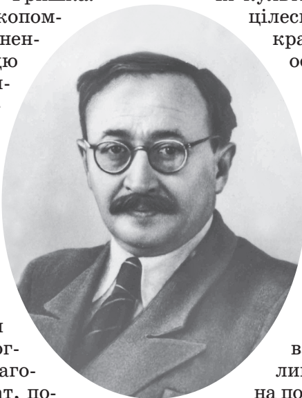
Рис. 1. Академік М. М. Гришко (1901–1964)

До вивчення сортів польових культур Микола Миколайович долучився зі студентської лави під керівництвом В. І. Сазанова, професора Полтавського агрокооперативного політехнікуму (нині Полтавська державна аграрна академія). В подальшому, працюючи в різних установах, він збирав сортови