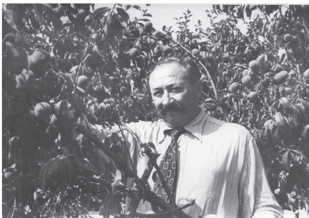
Рис. 5. М. М. Гришко біля виведеного ним сорту персикового дерева 'Слава Китаю' (1954 р.)

Працюючи в НБС, М. М. Гришко високо оцінив інтродукційну й селекційну роботу, започатковану М. Ф. Кащенком в Акліматизаційному саду, зокрема з добору та гібридизації перших форм персика, відносно стійких до місцевих умов [8]. М. М. Гришко дуже популяризував культуру персика для вирощування в північних районах України. Він продовжив роботу із селекції цієї культури, вивівши новий сорт 'Слава Китаю' (рис. 5), а також був ініціатором передачі кращих форм персика до Державного сортовипробування.