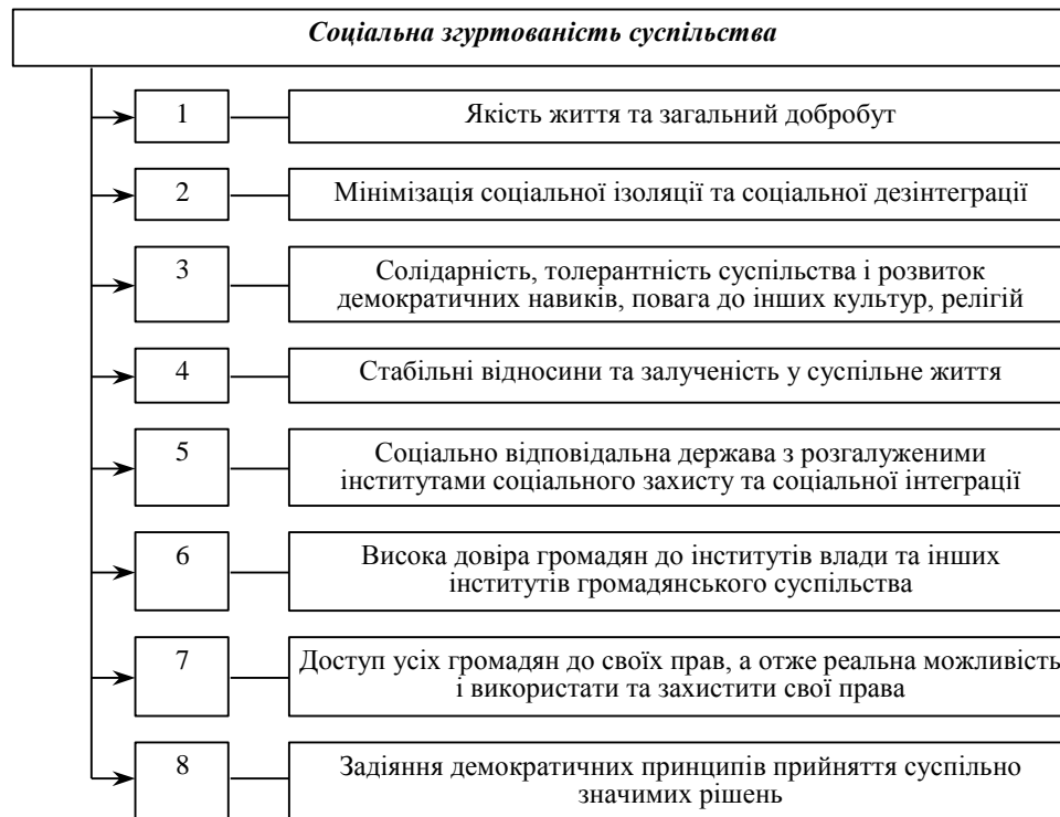
Рис. 1. Основні складові соціальної згуртованості суспільства