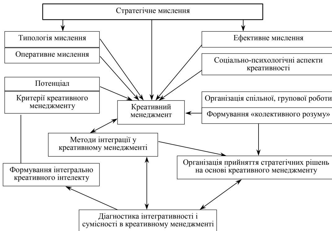
Рис. 1. Концепція креативного менеджменту [6]

Креативний менеджмент представляє собою управління носіями інтелектуального потенціалу підприємства, які створюють нові знання шляхом творчої діяльності. Креативний менеджмент заснований на сучасних технологіях управління творчістю та командної роботи [8, с. 85]. Завдання креативного менеджменту — управління процесом прийняття творчих рішень у колективі шляхом поєднання консервативного логічного мислення із законами сучасного менеджменту та польотом творчої фантазії. Концепцію креативного менеджменту подано на рис. 1.