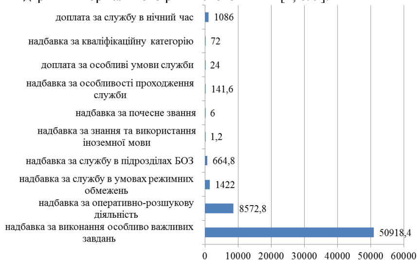
Рис.3. Розподіл додаткових видів грошового забезпечення осіб рядового і начальницького складу ОВС згідно кошторису на 2014р., тис. грн

Дані аналізу підтверджують і дані соціологічних опитувань визначають, що 96 % співробітників міліції повідомили, що не вважають свою заробітну плату справедливою та достатньою для підтримки нормального рівня свого життя [1, с. 9].