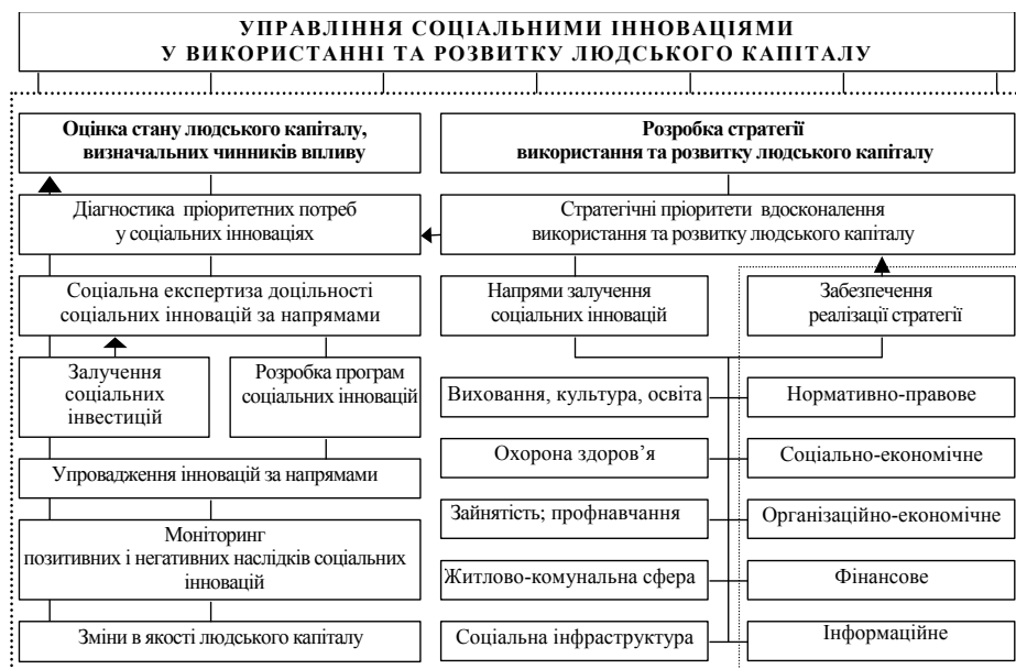
Рис. 2. Соціальні інновації як об'єкт управління в контексті реалізації стратегії використання та розвитку людського капіталу*

З нашої точки зору, управління соціальними інноваціями можна тлумачити як процес керованих інноваційних змін у дії визначальних чинників впливу на формування, використання та розвиток людського капіталу. Вважаємо, що цей процес має ґрунтуватися на системній, багаторівневій оцінці ролі зазначених чинників, визначенні адекватних і корисних інноваційних змін, що мають підпорядковуватися обраній стратегії використання та розвитку людського капіталу. Наш загальний підхід до управління соціальними інноваціями відображає схема на рис. 2.