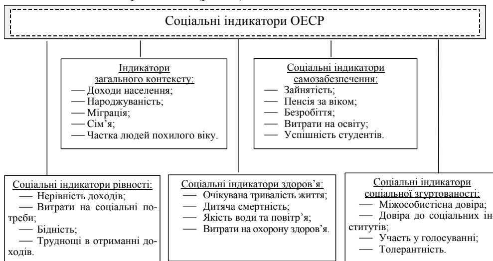
Рис. 2. Узагальнена структура системи основних соціальних індикаторів ОЕСР

У першому підході індикатори соціальної згуртованості суспільства інтегровані у загальну систему соціальних індикаторів ОЕСР (рис. 2).