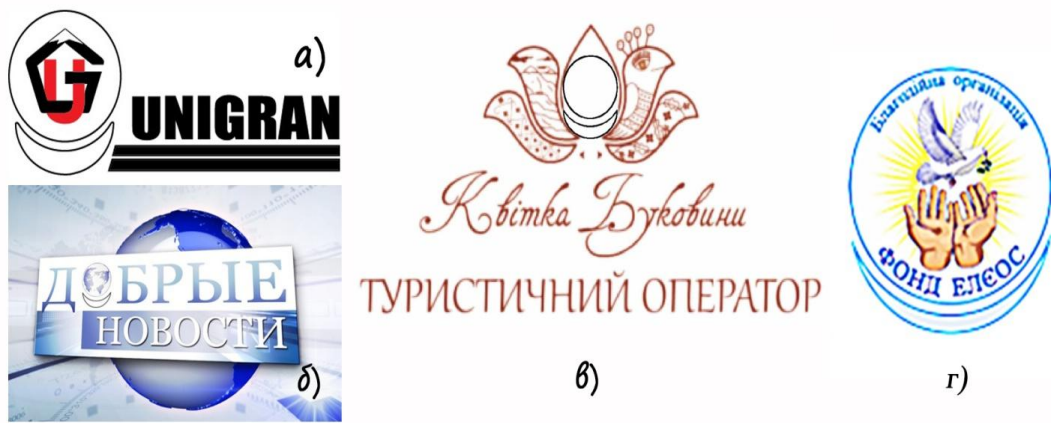
Рис.2. Логотипи компаній, у символіці яких є знак «АллатРа»