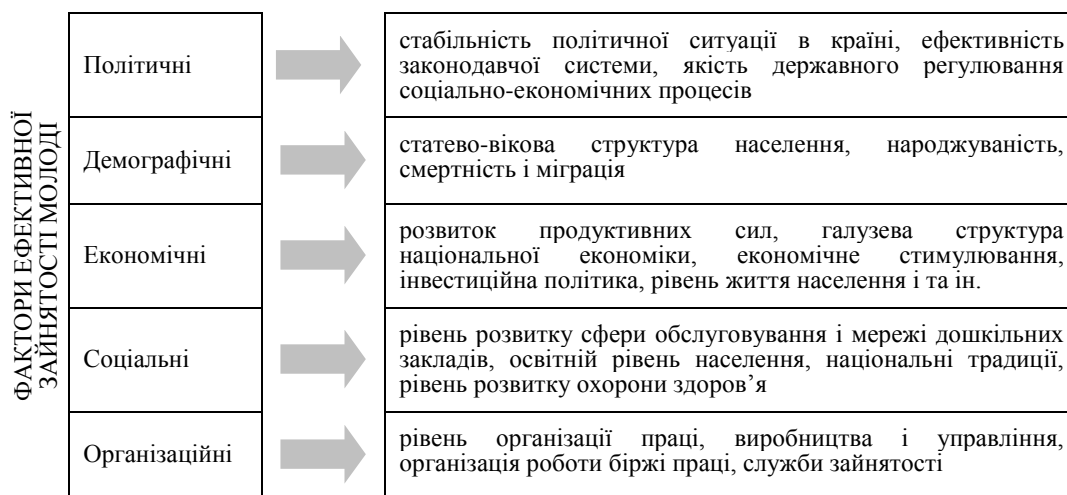
Рис. 2. Класифікація факторів зайнятості молоді

Запропонована класифікація дозволяє виявити і проаналізувати основні тенденції формування ефективної зайнятості молоді (рис. 2).