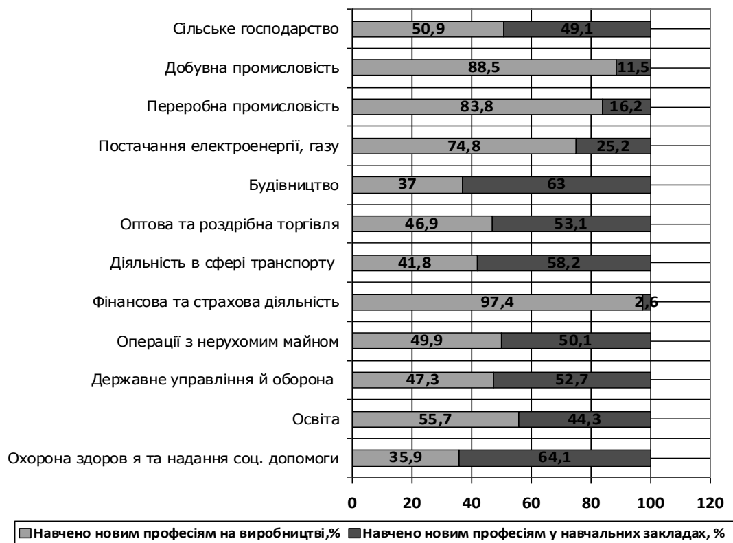
Рис. 2. Структура підготовки кадрів за місцем навчання та видами економічної діяльності, 2013 р, у % до облікової кількості працівників, які пройшли навчання [4]

У кінці 90-х років об'єми професійного навчання за індивідуальною формою нарощувалися незначними темпами, але починаючи з 2008 року цей напрямок професійного навчання став пріоритетним у роботі (табл. 2) [4]. Професійне навчання кадрів за індивідуальними навчальними планами та програмами сприяє здобуттю слухачами високого рівня знань, умінь і навичок, що відповідає вимогам роботодавців.