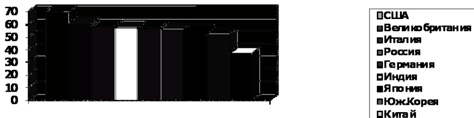
Рис. 1. Приватне споживання, % до ВВП, 2006 р.

Дані рис. 1 свідчать про те, що високий рівень приватного споживання можуть собі дозволити країни (США – 70 %, Великобританія – 61 %, Італія – 58 %, Німеччина – 57 %), які, по-перше, вже досягли високого рівня технологічного та економічного розвитку і подальший їх прогрес припускає повне насичення потреб на даному рівні розвитку до моменту, коли акумуляція знань для чергового технологічного стрибка викличе підвищення норми накопичення в суспільстві. По-друге, необхідно також, щоб рівень урядових витрат по відношенню до ВВП був невисоким. При цьому питома вага державного сектора в економіці повинна бути незначною, а рівень оподаткування — не більше 40 % ВВП. У принципі Україна вже досягла високого рівня приватного споживання без «дотримання» правил провідних країн світу та Європи.