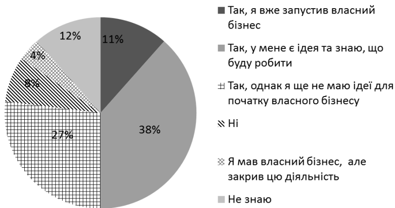
Рис.1. Розподіл відповідей на запитання «Чи розглядали Ви можливість розпочати власний бізнес?»