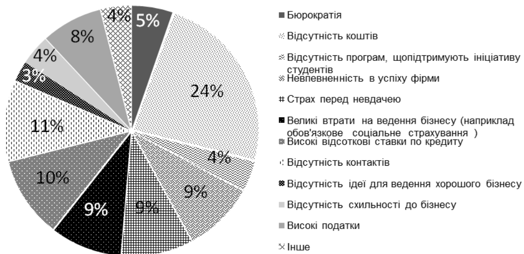
Рис. 4. Розподіл відповідей на запитання «Що для Вас є бар'єром для початку власного бізнесу?»

Що стосується об'єктивних і суб'єктивних перешкод і бар'єрів, з якими стикається саме молодь при створенні власного бізнесу, то ми отримали такі результати опитування (рис. 4).