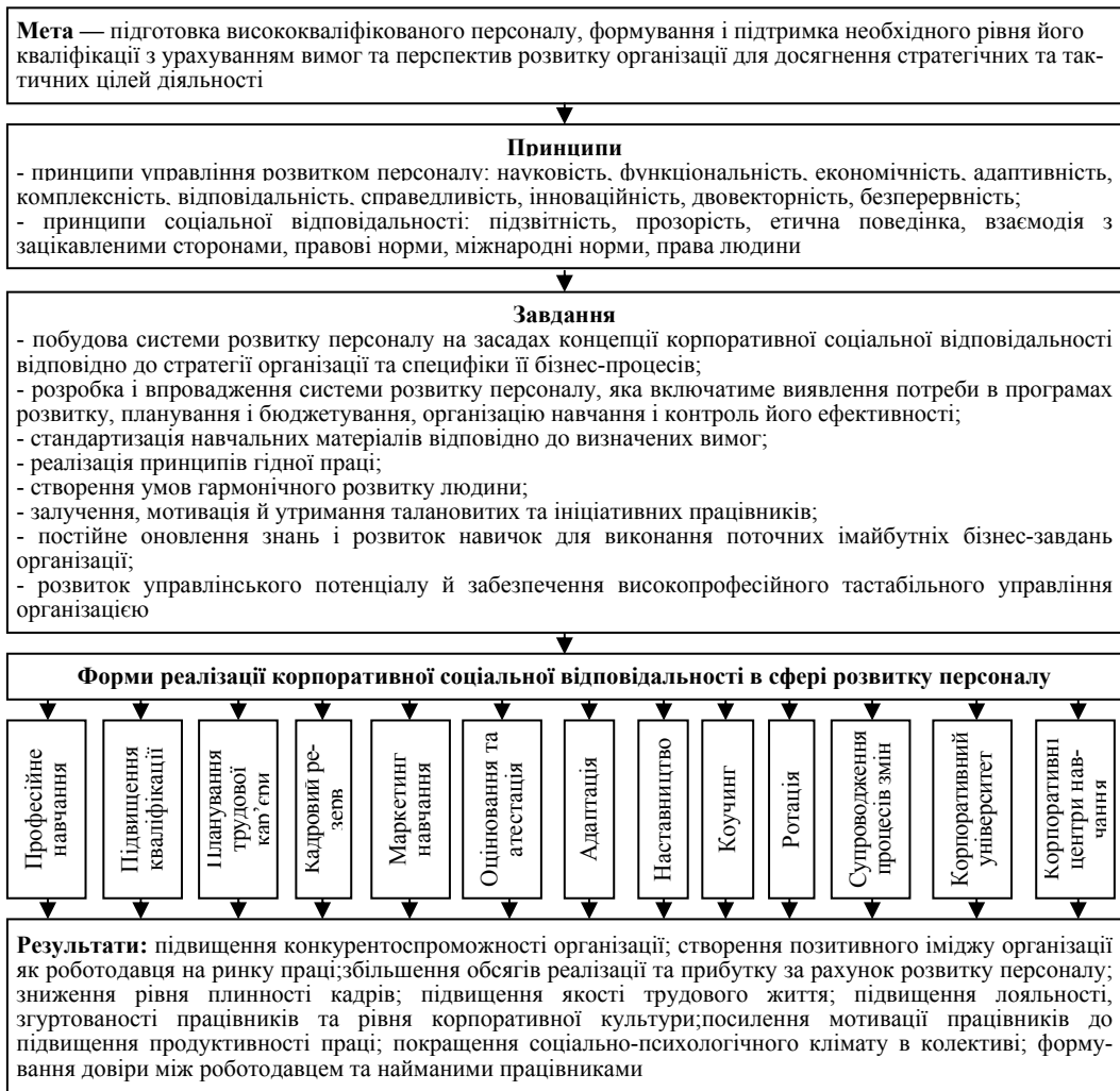
Рис. 2. Концептуальні засади реалізації корпоративної соціальної відповідальності в сфері розвитку персоналу