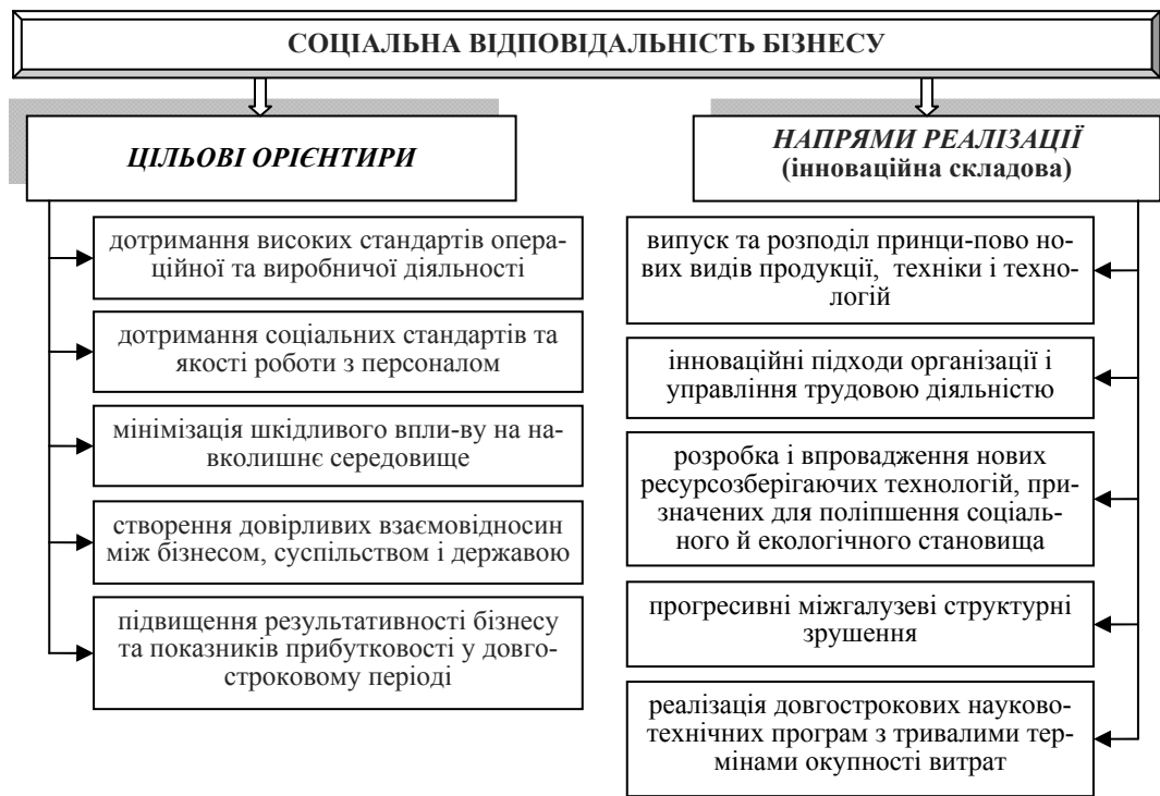
Рис. 1. Цільові орієнтири соціальної відповідальності бізнесу та напрями їх реалізації шляхом впровадження інноваційної політики

Згідно теорії розподілу соціальної відповідальності бізнесу за рівнями, запропонованої В. І. Спіранським, на першому рівні розташовується діяльність бізнесу, що характеризує його базову соціальну відповідальність [7, с. 86], відповідно до вимог якої: