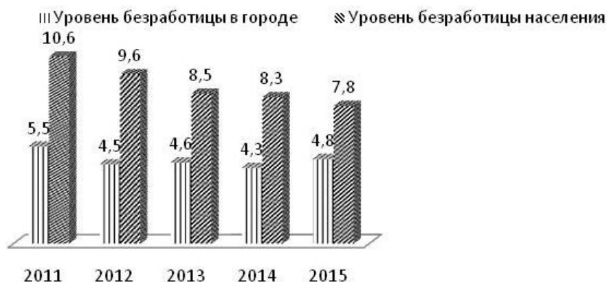
Рис. 1. Уровень безработицы в городской и сельской местности Воронежской области, %

Уровень безработицы в сельской местности Воронежской области значительно превышает уровень безработицы в городе почти в 2 раза (рис. 1). За анализируемый период 2011–2014 гг. в городе наблюдается тенденция к снижению уровня безработицы с 5,5 % до 4,3 %, в 2015 году произошел небольшой рост до 4,8 %. В сельской местности на протяжении всего периода наблюдается снижение уровня безработицы с 10,6 % в 2011 году до 7,8 % в 2015 году. Однако она по-прежнему гораздо выше, чем в городе.