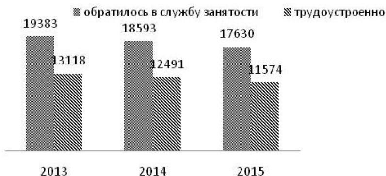
Рис. 3. Сельское население, обратившееся в службу занятости в 2013–2015 гг. в Воронежской области, чел.

Из сельского населения в органы службы занятости в 2013 году обратилось 3 % или 19383 человек, из них трудоустроено было 6,7 % или 13118 человек. В 2014 году в службу занятости обратилось 2,4 % или 18593 человек, 6,7 % или 12491 человек были трудоустроены. В 2015 году 2,3 % или 17630 человек обратилось в службу занятости, из них 6,5 % или 11574 человек трудоустроено (рис. 3) [3].