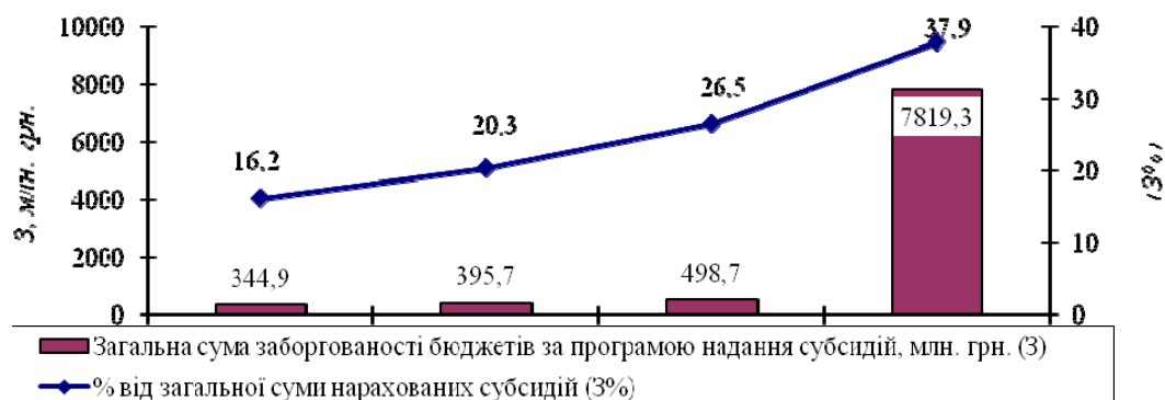
Рис. 2. Динаміка бюджетної заборгованості за програмою надання житлових субсидій в Україні, 2012–2015 рр. [7]

Крім того, наслідком такого різкого зростання нарахованих коштів за програмою житлових субсидій є зростання бюджетної заборгованості. Так, якщо у 2011–2014 рр. бюджетна заборгованість за програмою надання субсидій варіювала в межах від 345 до 500 млн грн, то у 2015 р. – 7,8 млрд грн або 38 % від загальної суми нарахованих субсидій (рис. 2).