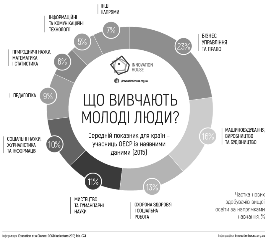
Рис. 1. Дисципліни, які вивчає молодь, 2017 [9]

З іншого боку, задля розуміння розподілу напрямів підготовки молодих фахівців в Україні, варто проаналізувати результати дослідження Innovation House (рис. 1). Так, досі найпопулярнішими залишаються бізнес, управління і право — 23 %, машинобудування, виробництво та будівництво — 16 %, охорона здоров'я та соціальна робота — 13 %, гуманітарні науки і журналістика — 11 % і 10 % відповідно.