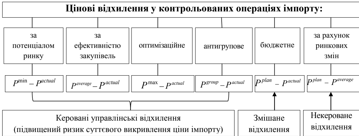
Рис. 3. Система цінових відхилень у контрольованих операціях імпорту

Отже вищевказані розрахунки дозволяють окреслити загальну систему відхилень трансфертних цін та є підґрунтям відповідної системи контролю й аналізу таких відхилень з метою аудиту контрольованих операцій (рис. 3). Як видно з рисунку, цінові відхилення у контрольованих операціях імпорту можна розподілити на ті, які підпадають під ризик суттєвого викривлення, або керовані управлінські відхилення, та ті, які не характеризуються ймовірністю викривлення, – некеровані.