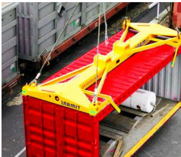
Рис. 2. Вагова платформа з динамометром

Відома система зважування контейнерів складається з вагової платформи та динамометричного чутливого елемента між платформою та вантажним гаком (рис. 2) [4].