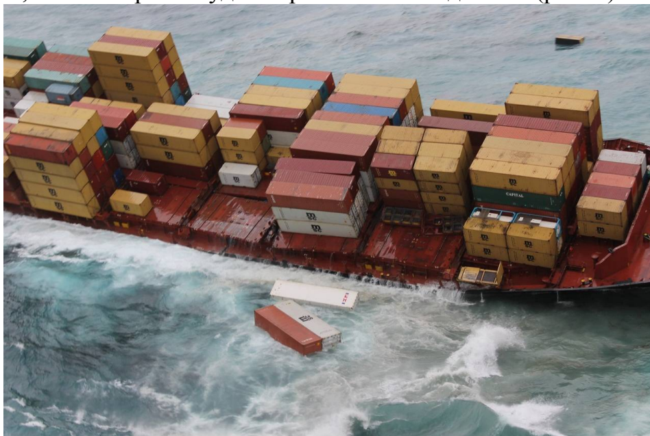
Рис. 1. Аварія контейнеровоза

Зважування всіх контейнерів стане в ближньому майбутньому реальністю для термінальних операторів. Яке ж підґрунтя для впровадження правил щодо зважування контейнерів вимагає International Maritime Organization (ІМО)? ІМО, по-перше, вважає найбільш доцільним запобігти аварійним ситуаціям з морськими суднами, які є наслідком втрати контейнеровозами остійності. За результатами досліджень ІМО, чисельні аварії з контейнерними суднами були викликані саме тим, що неправильно була вказана вага контейнерів. Внаслідок чого вантаж, контейнери та судно отримали пошкодження (рис. 1).