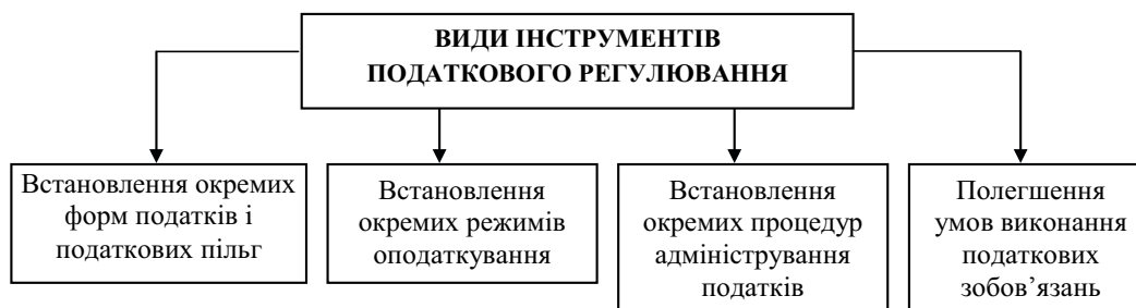
Рис. 3. Види інструментів антикризового податкового регулювання

Податкові реформи в Російській Федерації стосуються податку на прибуток, ставку якого у 2009 р. знижено з 24% до 20%, а також зменшено базу оподаткування за рахунок вирахування повної суми витрат на навчання та професійну підготовку, сум відшкодування витрат працівників зі сплати відсотків по позиках на придбання й/або будівництво житлового приміщення в розмірі до 3% від суми виплат на оплату праці (діє до 2012 р.) та внесків роботодавців на додаткове пенсійне страхування. Перші дві групи витрат також не оподатковуються податком на