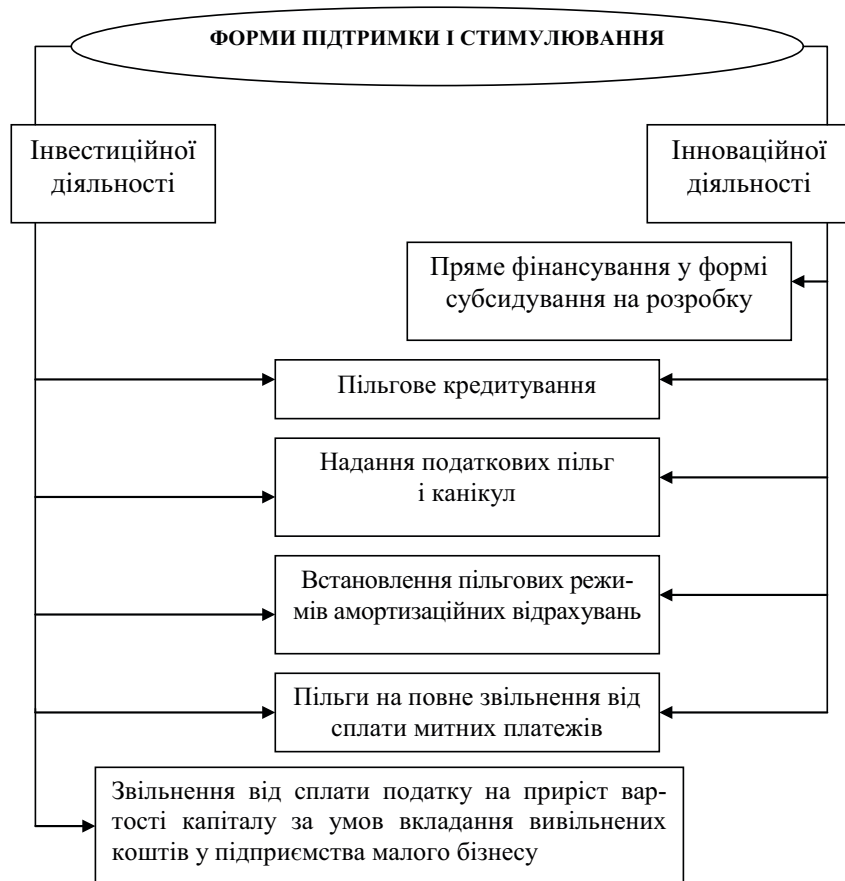
Рис. 2. Основні форми підтримки та стимулювання інвестиційної та інноваційної діяльності

Податкове регулювання в інвестиційно-інноваційній сфері здійснюється через надання податкової знижки на інвестиції та витрати у НДДКР, що дозволяє підприємствам фактично зменшувати прибуток до оподаткування на чітко встановлений відсоток витрат капітального характеру. Іншою найчастіше використовуваною формою пільг є інвестиційний податковий кредит, що передбачає зменшення податкових зобов'язань підприємства з податку