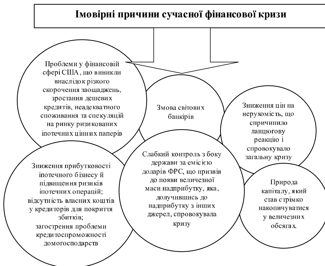
Рис. 2. Імовірні причини сучасної фінансової кризи

Сьогодні міжнародна валютна система не має механізму для запобігання стій-