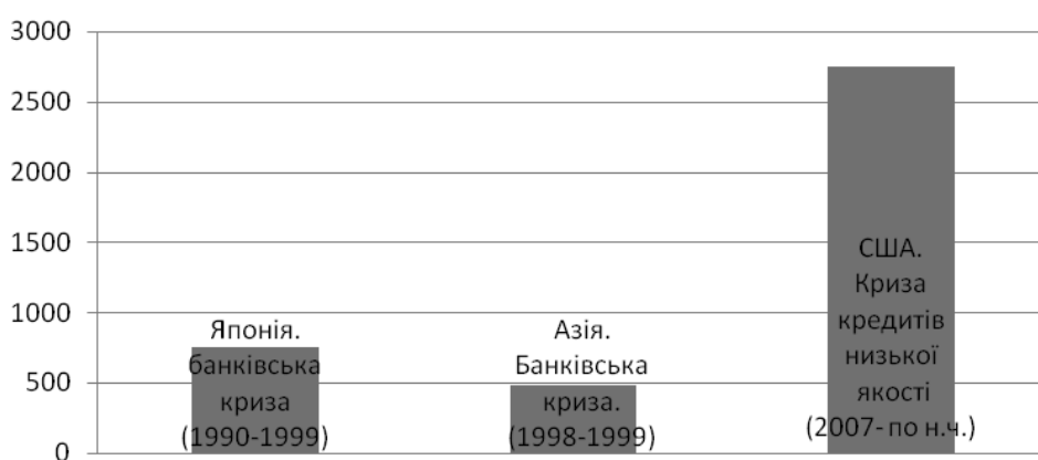
Рис. 3. Втрати від фінансових криз, млрд. дол. США*

Ретроспективний аналіз попередніх криз дає змогу сформуванню основних причин, тенденцій, закономірності їх виникнення. Масштабні світові кризи розгорнулися в економічно розвинутих країнах і ланцюговою реакцією зачіпали решту держав світу. Тому можна сформулювати гіпотезу прямопропорційності масштабності кризи та економічної розвине-